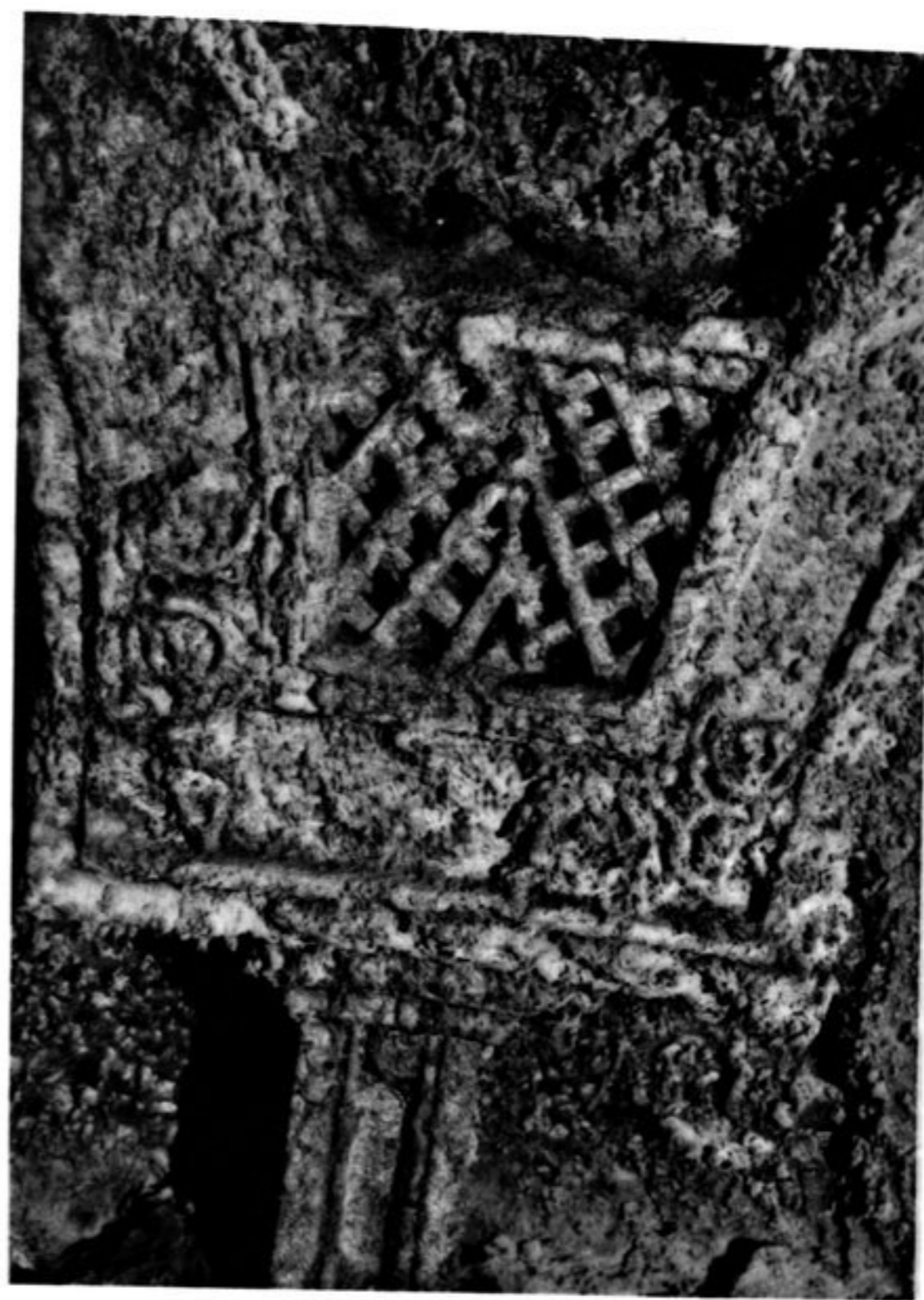
FIG. 41. — GROTTA XI. PIÈCE DE RACCORD A LA DEUXIÈME RANGÉE D'ARCATURES.