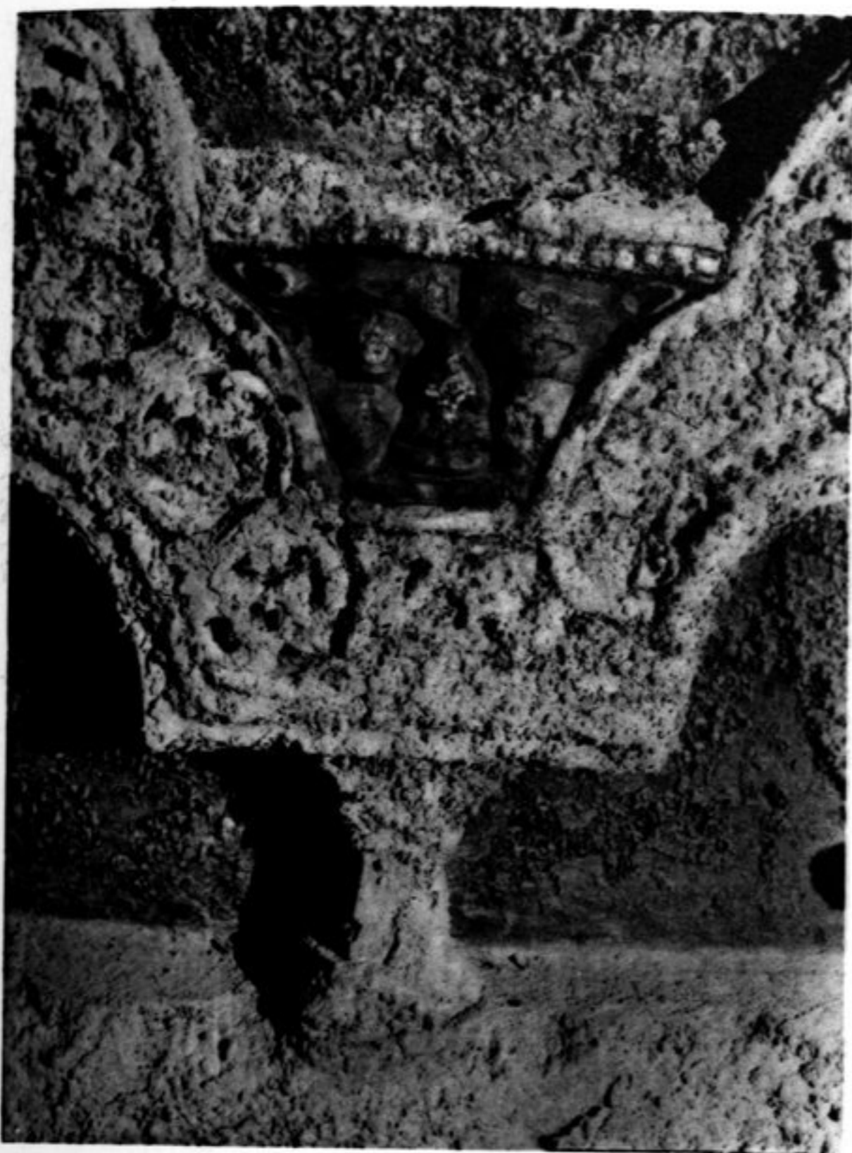
FIG. 40. — GROTTA XI. KĪRTI-MUKHA.