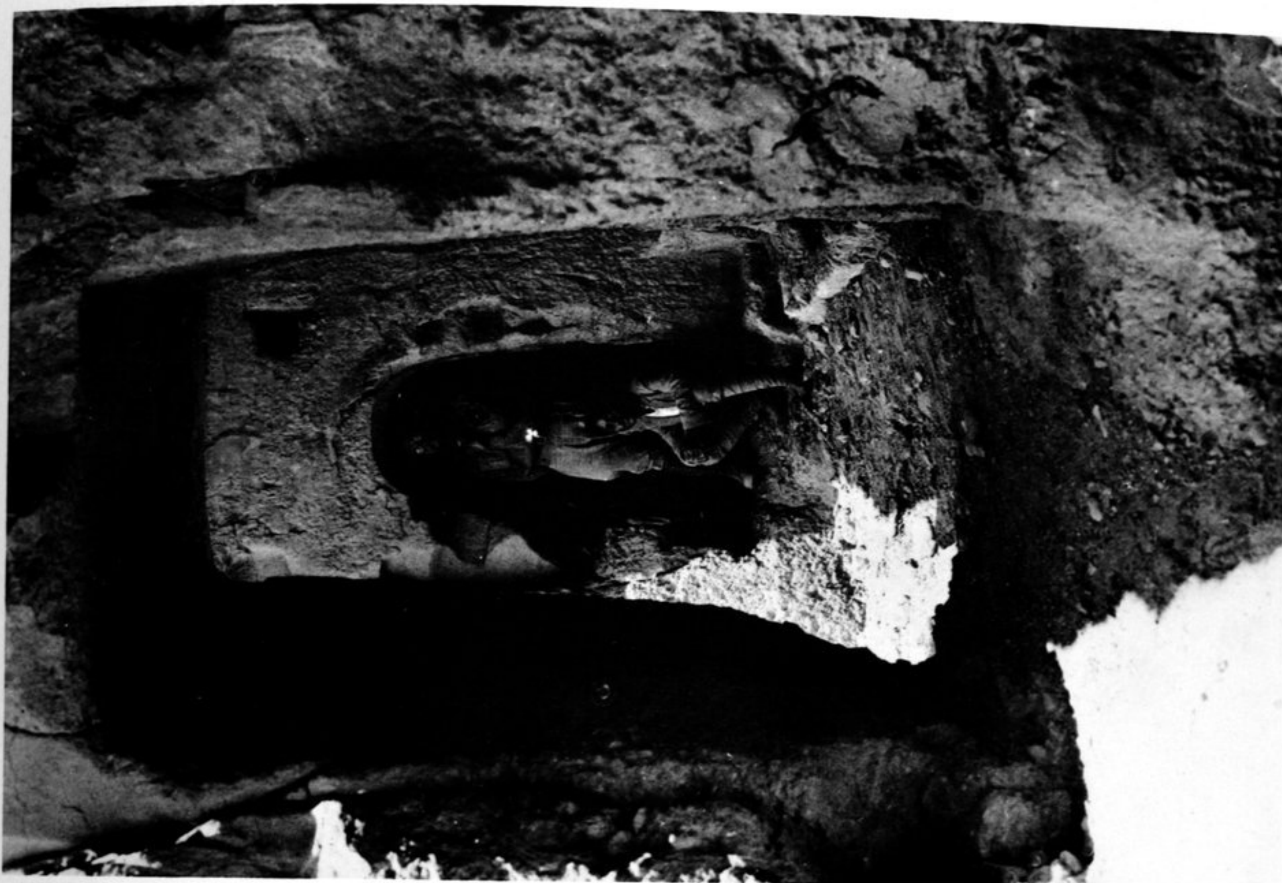
FIG. 51. — INTÉRIEUR DU GROUPE DE GROTTES XII.