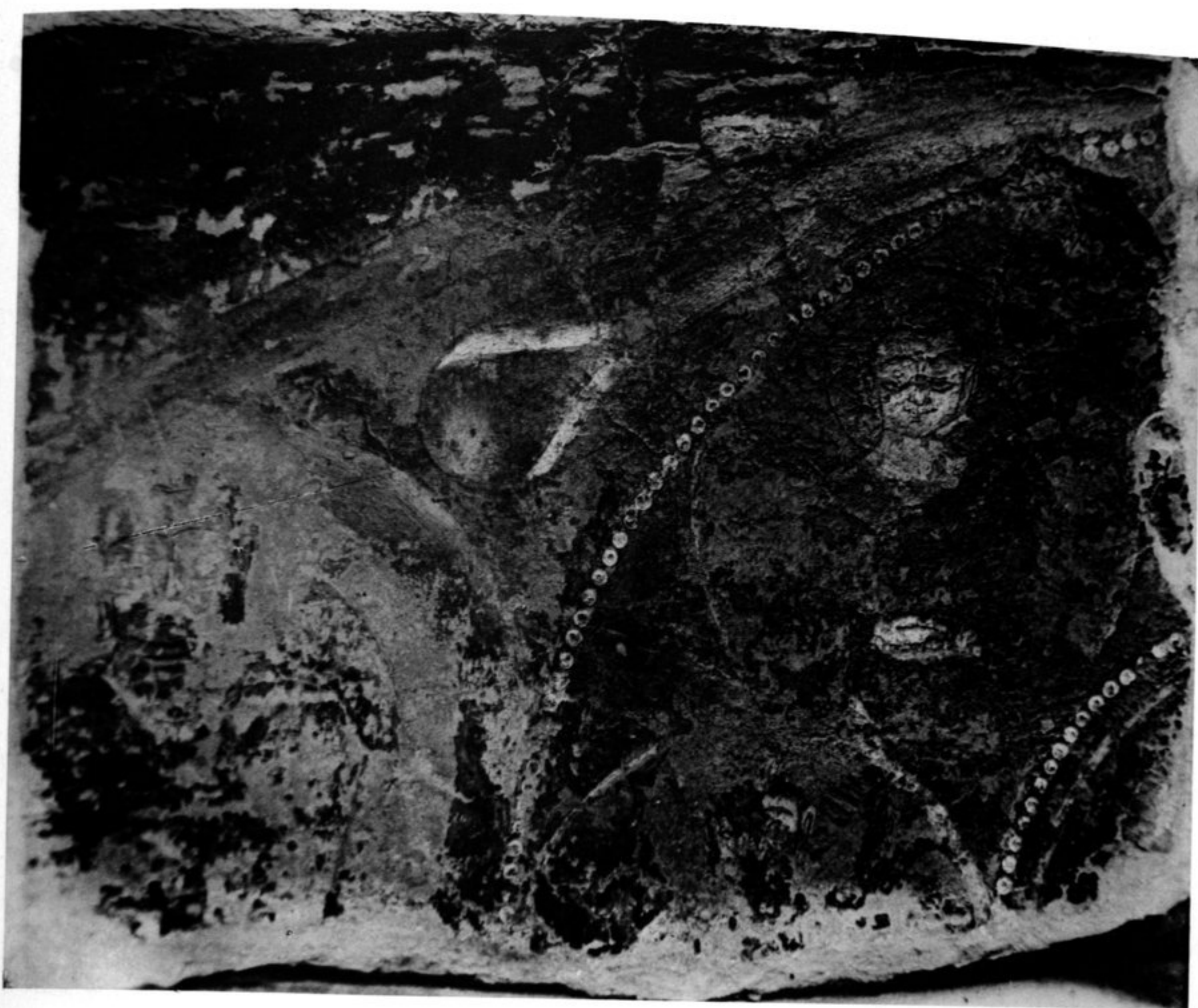
FIG. 67. — SANCTUAIRE DE KAKRAK. FRAGMENT D'UN GRAND CERCLE DU PANNEAU F DU SANCTUAIRE.