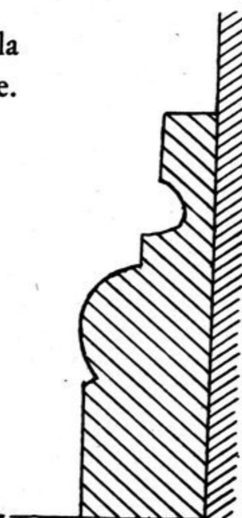
FIG. 47. — Profil de la base du st. TK, 3.

Base classique. Les pilastres sont au nombre de cinq, très élancés, portant, chacun, le symbole en H étroit et très allongé.