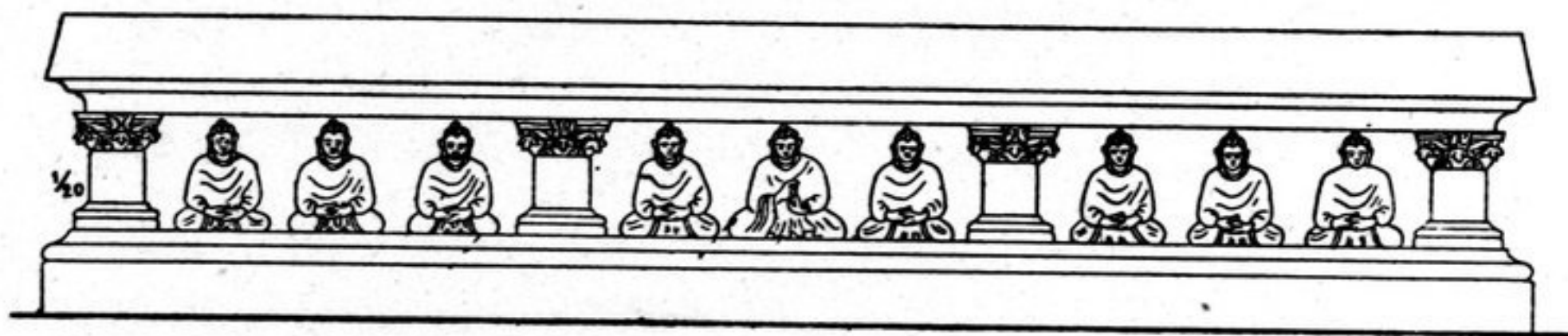
FIG. 58. — Façade du st. TK, 36 (Éch. 1/20).

Il n'en reste, comme précédemment, que le premier corps carré avec quatre pilastres de 0 m. 21 portant le symbole en H et séparant des Bouddhas en méditation, isolés ou par groupes de trois (TK, 36). Les bases sont un peu différentes l'une de l'autre.