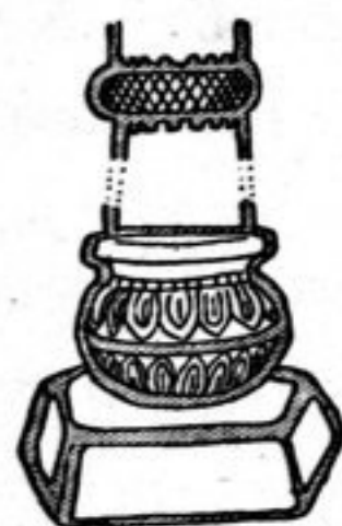
FIG. 144. — Pilastre, à base bulboïde, des côtés du vestibule de B, 56.

Les deux faces internes m, et n, du vestibule (II, pl. 14, c et 15) sont presque intactes avec leurs deux étages de Bouddhas superposés. Les pilastres, de part et d'autre, sont ronds, sauf le chapiteau resté anguleux. Ils sont élancés et contrairement à ce que l'on voit dans les deux façades voisines, ils n'arrivent qu'à mi-hauteur pour porter le cintre des niches. Tous les personnages abrités sous les arcs sont des Bouddhas en marche. Celui de droite tient dans un bol à aumônes un