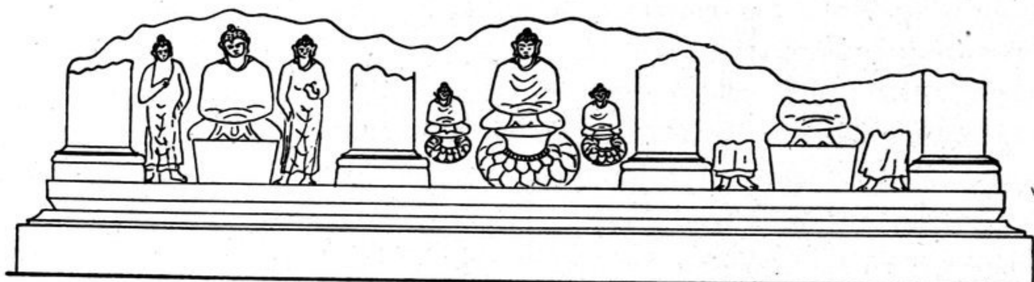
FIG. 156. — Façade SE. du st. B, 76.

Côté : 2 m. 20. Quatre pilastres à chaque façade. Dans les deux intervalles extrêmes de la façade méridionale, un Bouddha assis à l'orientale repose sur un trône en trapèze s'évasant de la base au sommet et dépourvu d'ornements. De chaque côté se tient un Bouddha en marche. Dans l'intervalle du milieu, le trône est en fleur de lotus aplatie contre la paroi du stūpa , avec son fruit en pomme d'arrosoir. Deux petits Bouddhas semblables sont de part et d'autre du Bouddha médian, au niveau des socles de chaque pilastre.