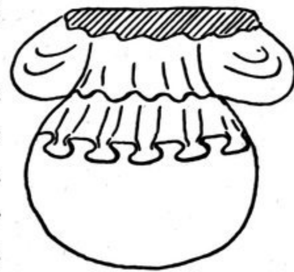
FIG. 180 bis. — Draperie en godets d'un Bouddha de A, 1.

Le corps du stûpa était dépourvu de pilastres; mais contre ses parois, et à des distances variant de 0 m. 80 à 0 m. 90, s'alignaient, sur chaque façade, des Bouddhas en marche ou au repos, grandeur naturelle, dont la partie inférieure seule a subsisté. On en retrouve sur les façades antérieures et sur les côtés des angles saillants, de même que le long des parois de l'escalier. Ici, ils étaient séparés par d'autres, en méditation, aurolés et placés à des hauteurs différentes. Chacune des statues, d'un relief très accentué, reposait sur un socle lenticulaire à surface inférieure très bombée. Les petits