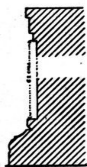
FIG. 190. Profil du st. D, 2, base et soubassement.

Côtés : 3 m, 90. Ces deux stūpa sont symétriques des stūpa D, 8 et D, 9, par rapport à D, 1, mais un peu dissemblables. La base de D, 2 a une scotie, alors que l'autre est plus simple. Les stūpa étaient inachevés, abandonnés avant que pilastres et Bouddha y aient été placés.