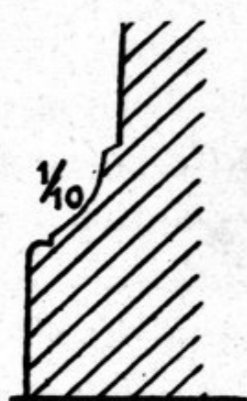
FIG. 191. Base du st. D, 3.

Les escaliers sont dirigés vers D, 1. Ils mesurent 1 m. 40 de long.