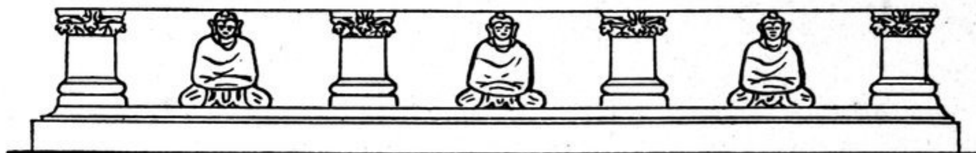
FIG. 197. — Façade du st. D, 12.

Côté : 2 m. 60. On voit encore, malgré la dégradation, les traces de quatre pilastres et de Bouddhas en méditation, mains voilées, sur le corps inférieur. Il ne reste plus rien de l'entablement. Ce stûpa était entouré d'un mur.