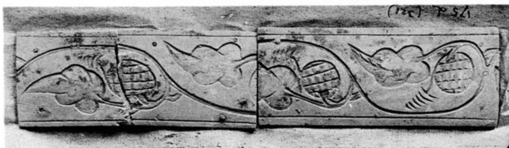
FIG. 98. — N° 321 [175, d]