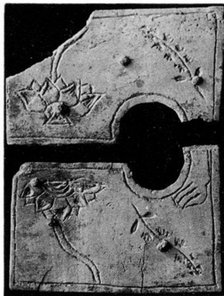
FIG. 95. — N° 328 [182, i]