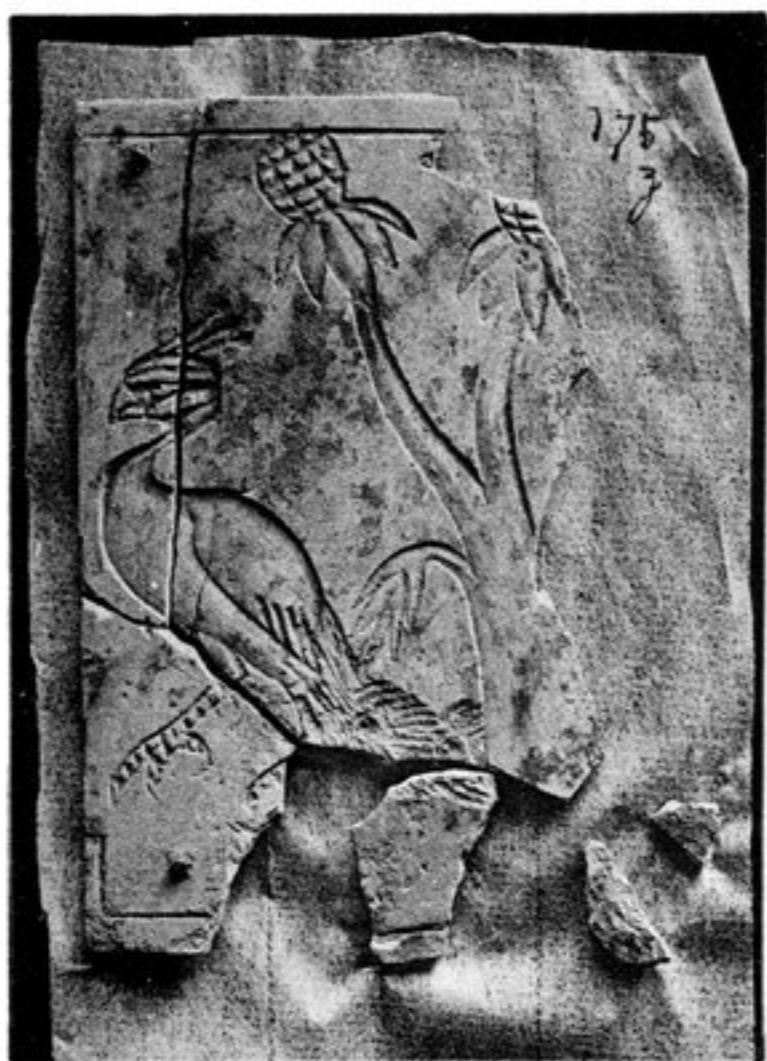
FIG. 94. — N° 321 [175, z]