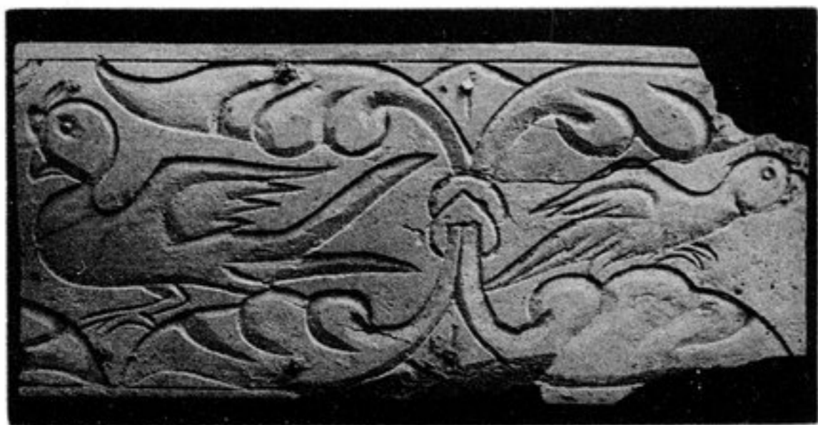
FIG. 89. — N° 321 [175, f i]