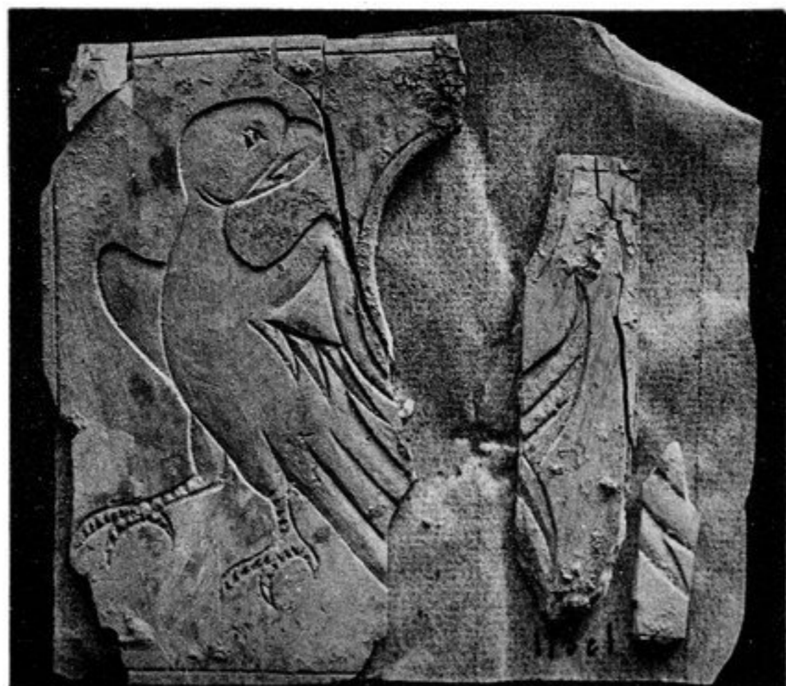
FIG. 90. — N° 321 [175, c i]