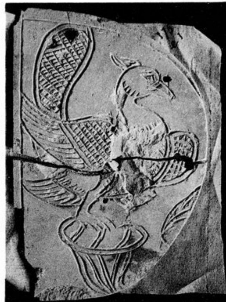
FIG. 92. — N° 321 [175, e i]