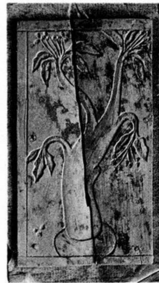
FIG. 97. — N° 321 [175, v]