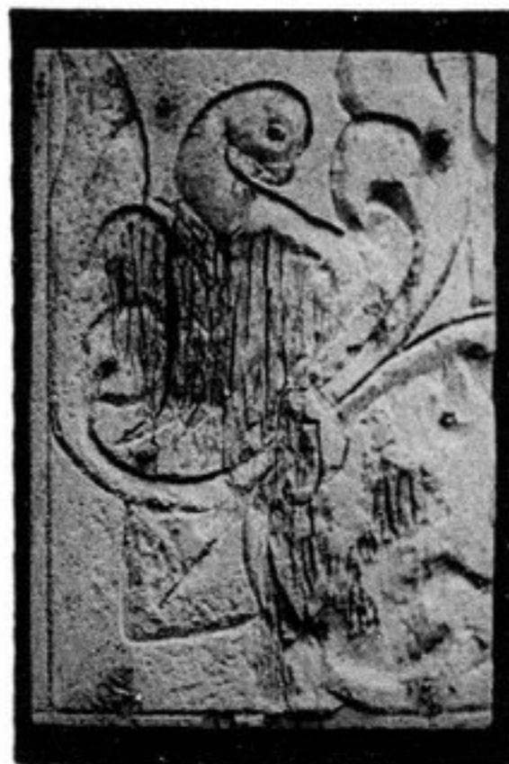
FIG. 91. — N° 321 [175, g i]