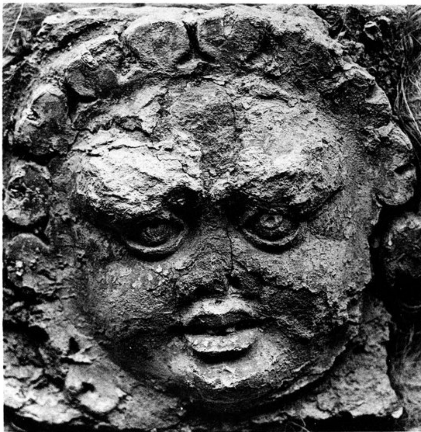
FIG. 123. — FONDUKISTAN