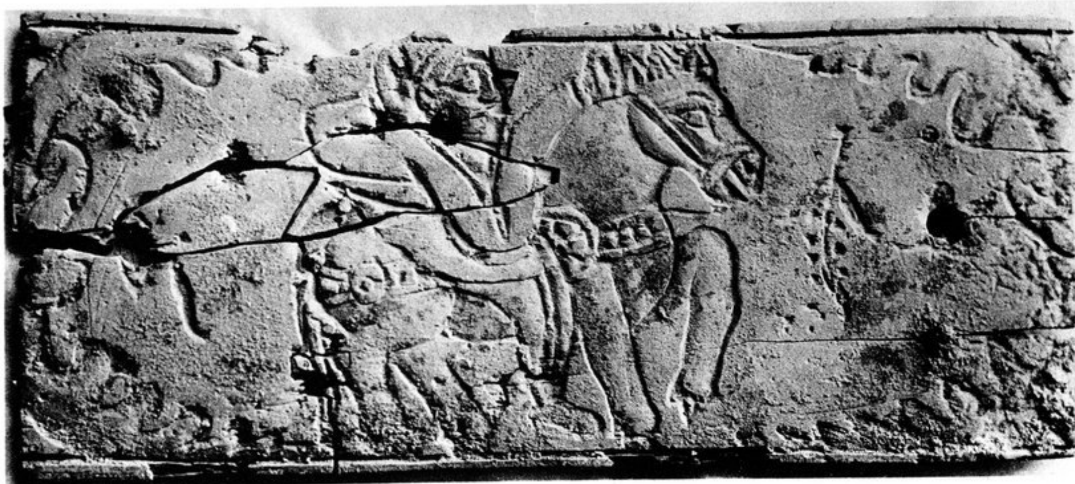
FIG. 125. — N° 325 [179, y]