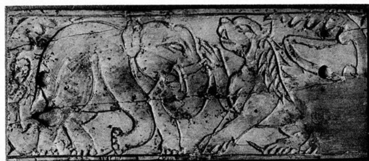
FIG. 124. — N° 325 [179, x]