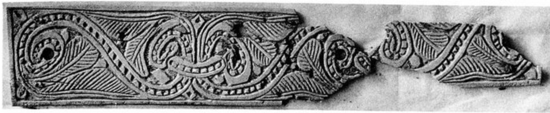
FIG. 119. — N° 325 [179, o 1]