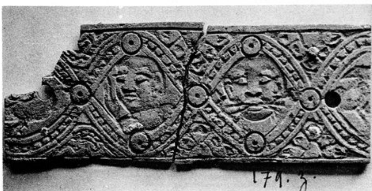
FIG. 122. — N° 325 [179, z]