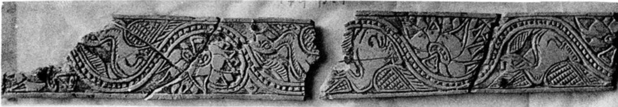
FIG. 120. — N° 325 [179, p 1]