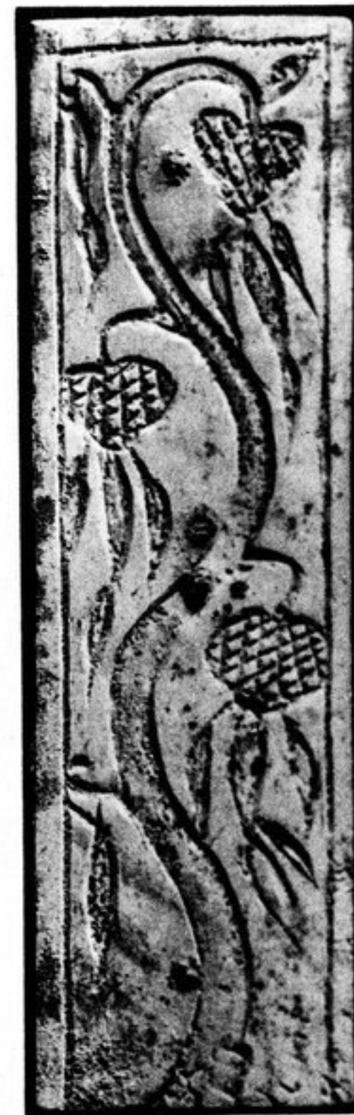
FIG. 121. — N° 325 [179, f 1]