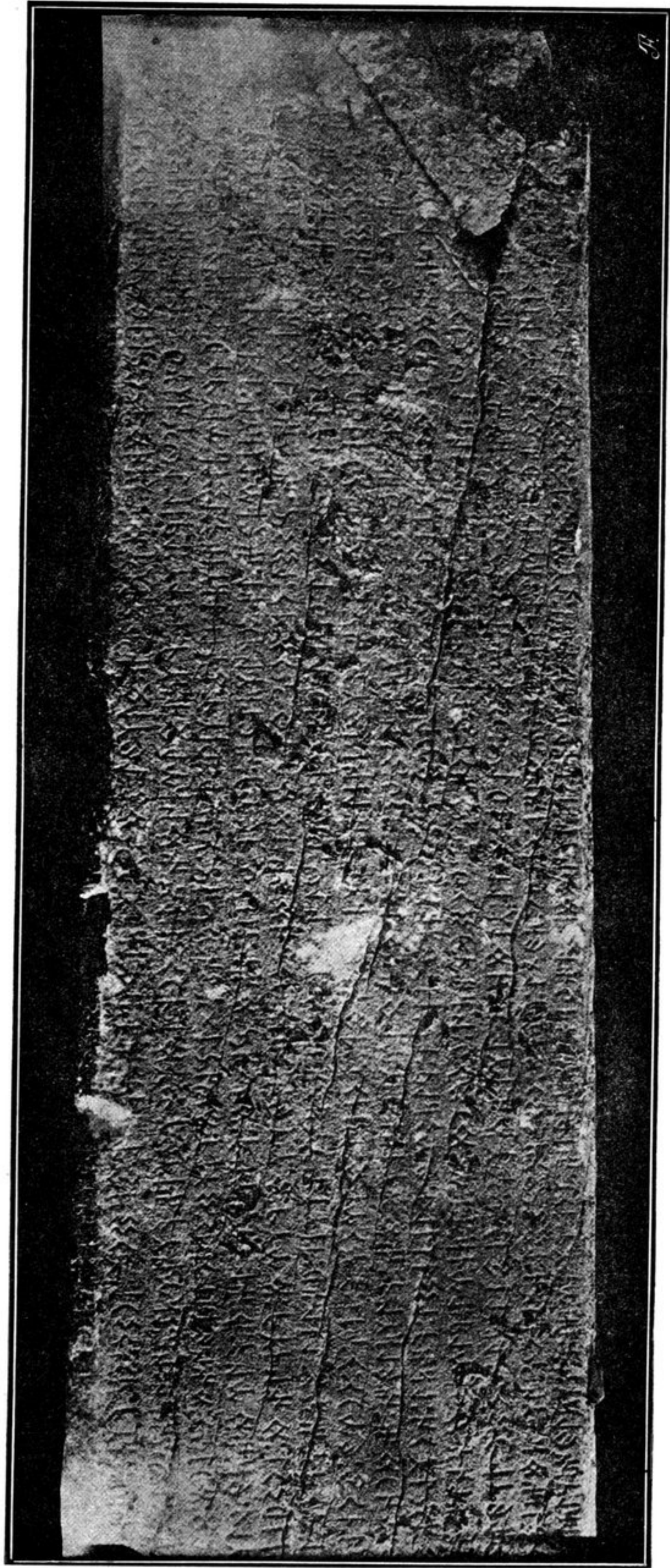
I MONUM. CÔTE DU NORD, PARTIE SUPÉRIEURE.

70 57 58 59 60 61 62 63 64 65 66 67 68 69