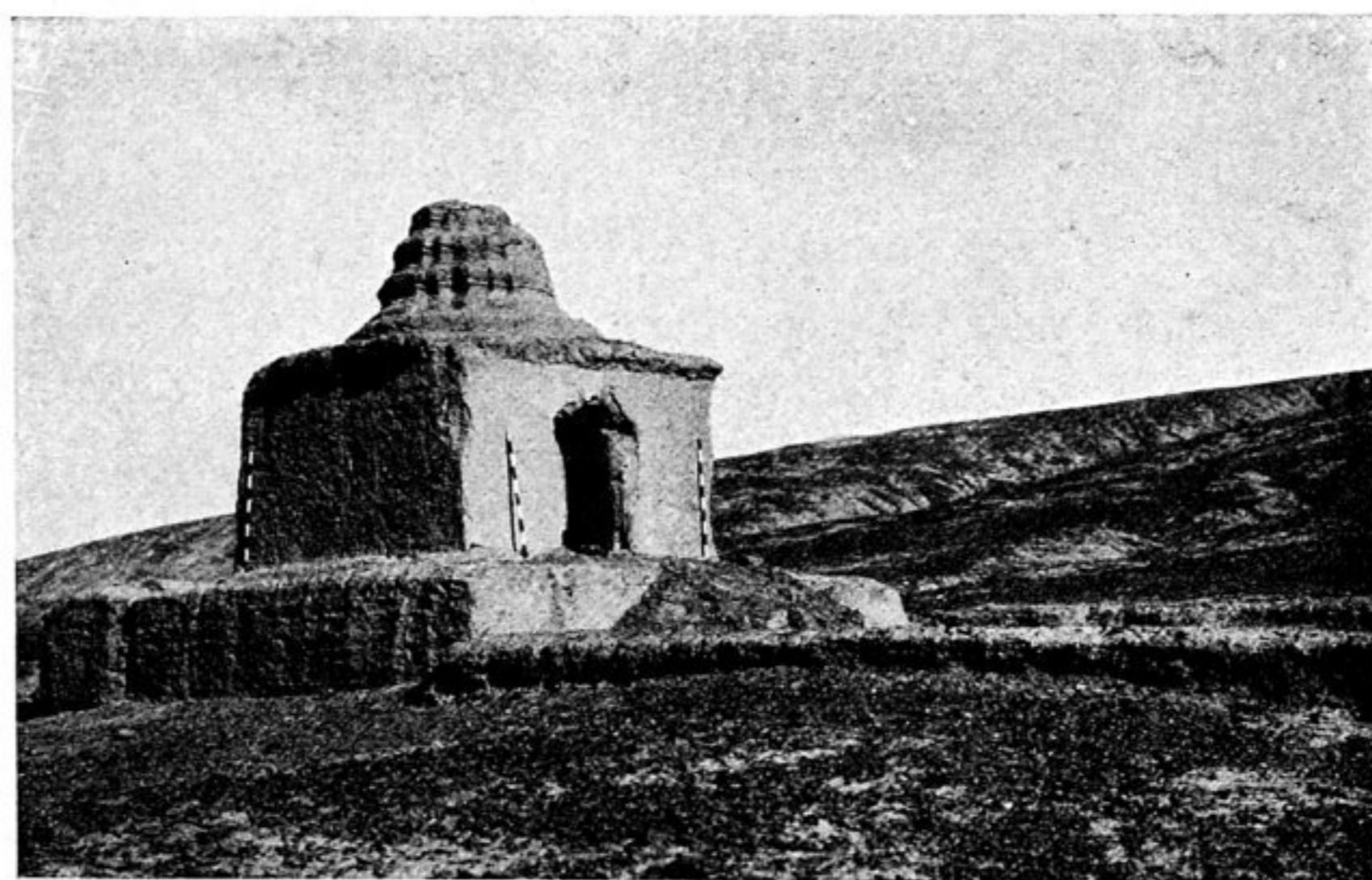
36. Храмъ - чайтъя № 2 въ предгорьяхъ близъ ущелья Таллык-булак.

Обѣ боковыя стѣны пещеры надъ красною полосою заняты изображеніями такъ называемыхъ волхвовъ (siddha) въ четырехугольникахъ, у которыхъ въ верхнемъ углу по картушѣ съ уйгурскою надписью, которая иногда переходитъ на рамку. Плафонъ пещеры: узорчатые круги, въ нихъ viçva-vaġga, въ промежуткахъ растительный орнаментъ (см. рис. 37, таблицу XXVIII). Тамъ, гдѣ кончаются полосы съ siddha и до входа справа и слѣва есть еще слѣды росписи; справа: 1) конецъ ноги и копыто лошади, 2)?, но не сінтāмапі (ср. слѣва 3), 3)?, 4) дерево; подъ нимъ, очевидно, сидѣла фигура, слѣды нимба которой видны. Слева: 1) nāgī, 2) медальонъ, съ ?, 3) сінтāмапі, 4) ноги льва, 5) фигура