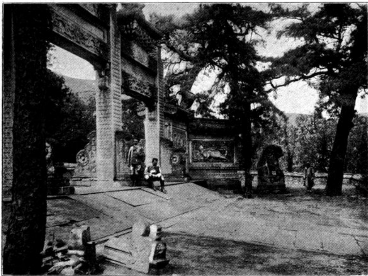
Un des trois portiques d'entrée du temple de Confucius à Pe King

a) Les Se-chou , ou Quatre Livres, comprennent le Ta-hio ou Grande Science, composé de onze chapitres, dont le premier renferme les paroles de Confucius, les dix autres sont de Tseng tseu son disciple; — le Tchoung Young , ou le Juste Milieu, qui est de Tseu-seu, son petit-fils; ces deux livres formaient deux chapitres du Li-ki ; — le Louen-yu , 11.705 caractères, avec la paraphrase 76.736 caractères, conversations entre Confucius et ses disciples, en vingt chapitres, n'a pas été rédigé par le Sage; pas plus naturellement que le Meng-tseu , 34.685 caractères, avec le commentaire 209.749, livre du philosophe Mencius.