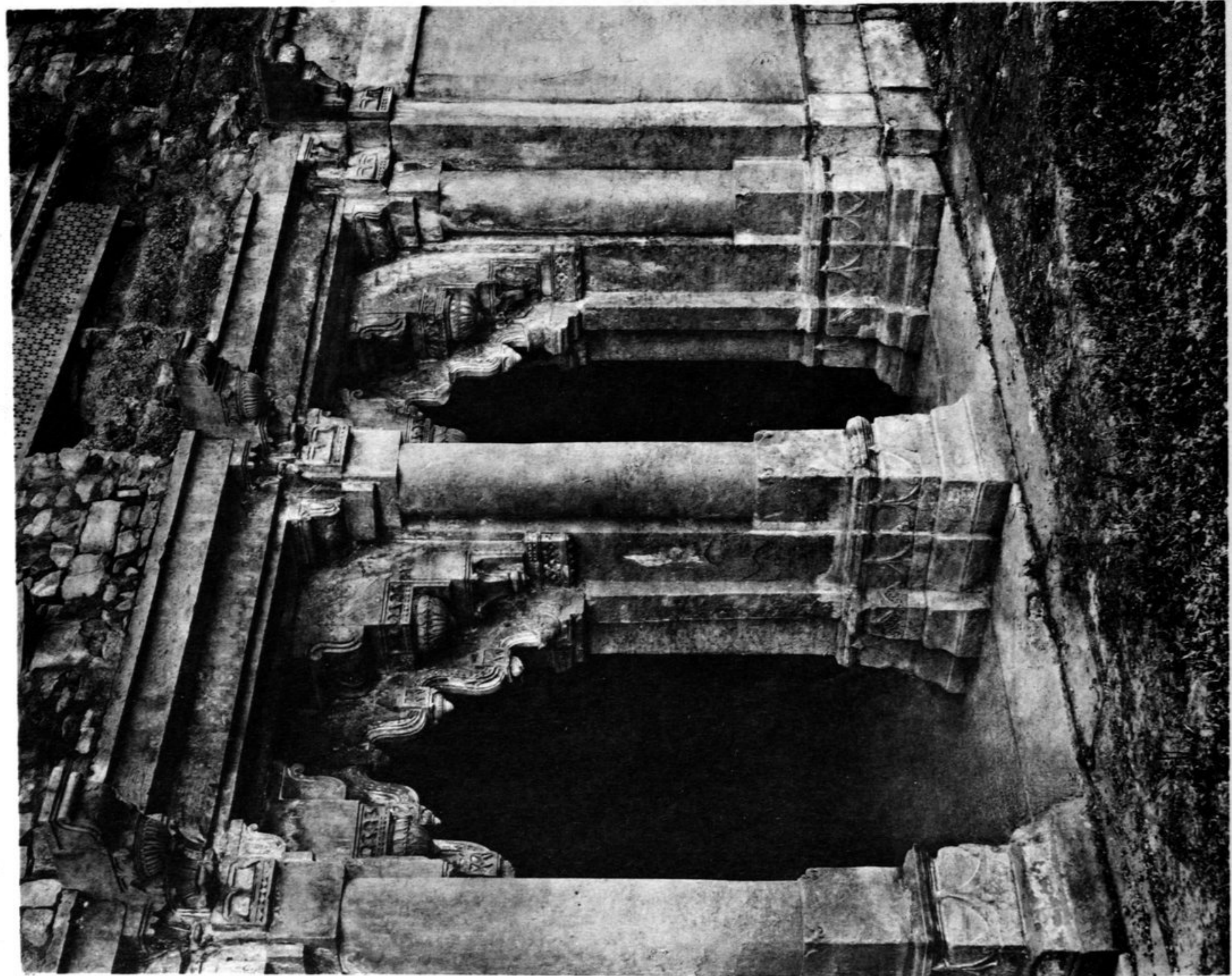
Südseite des Hofes 2.