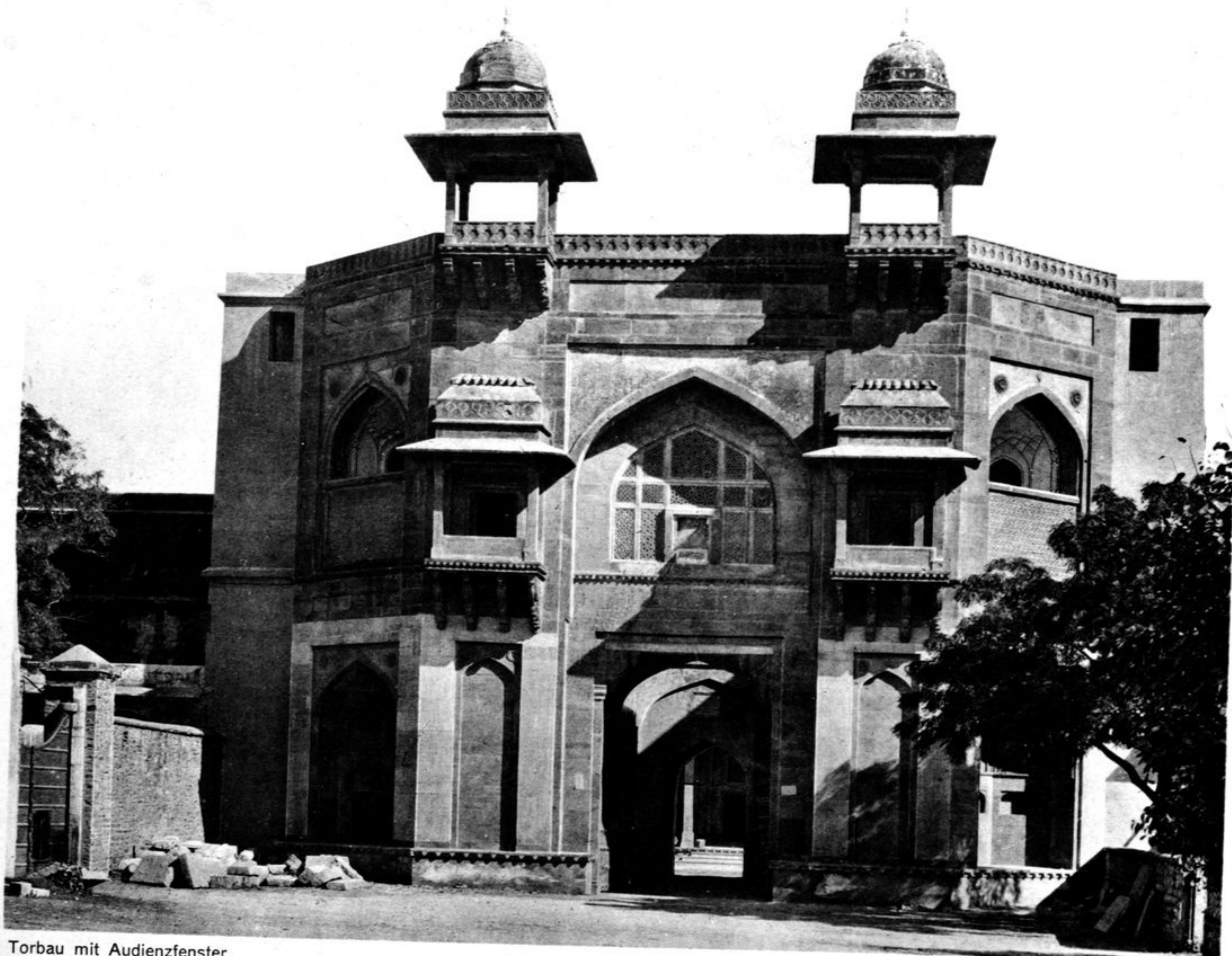
Torbau mit Audienzfenster.