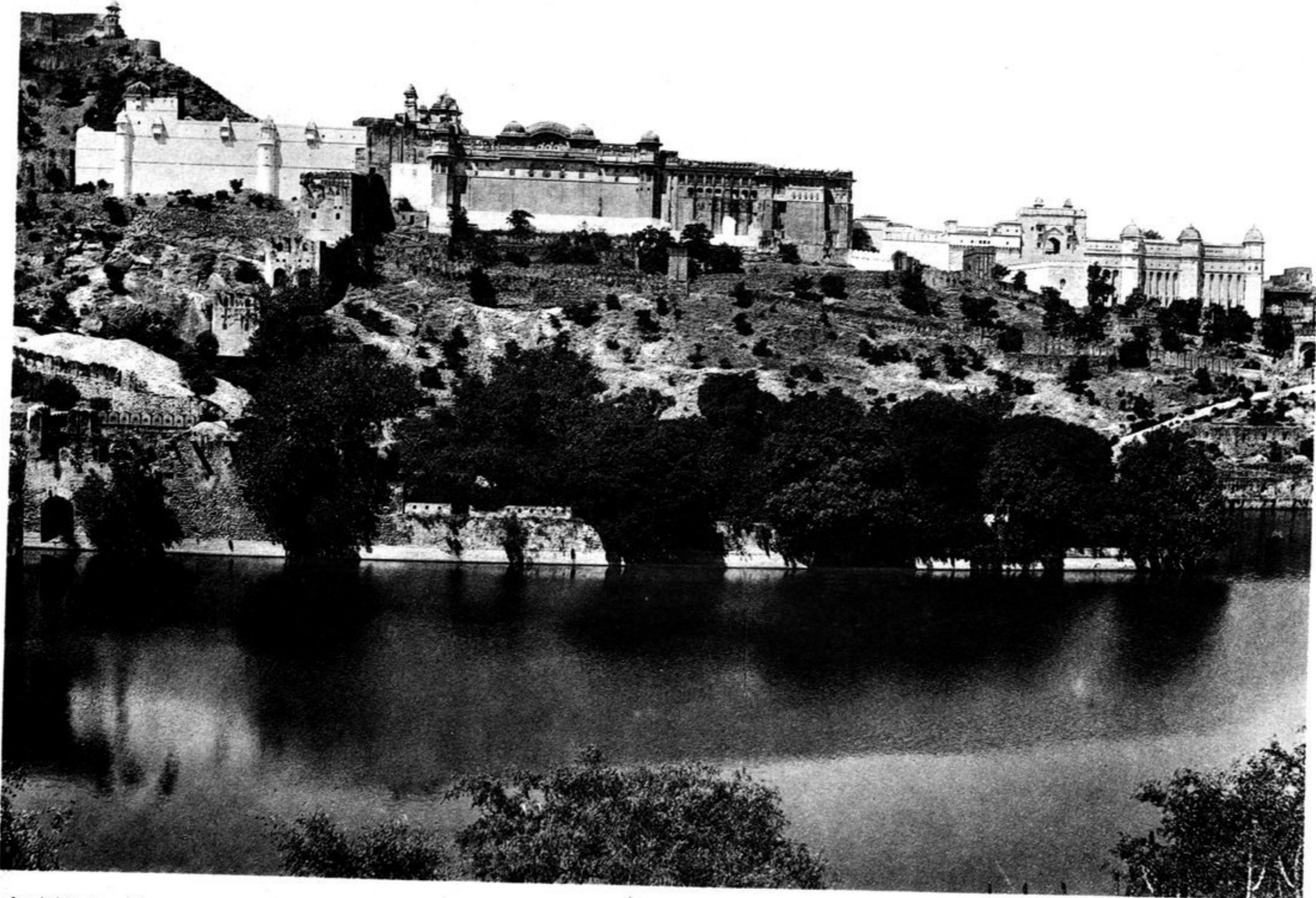
Ansicht vom See.