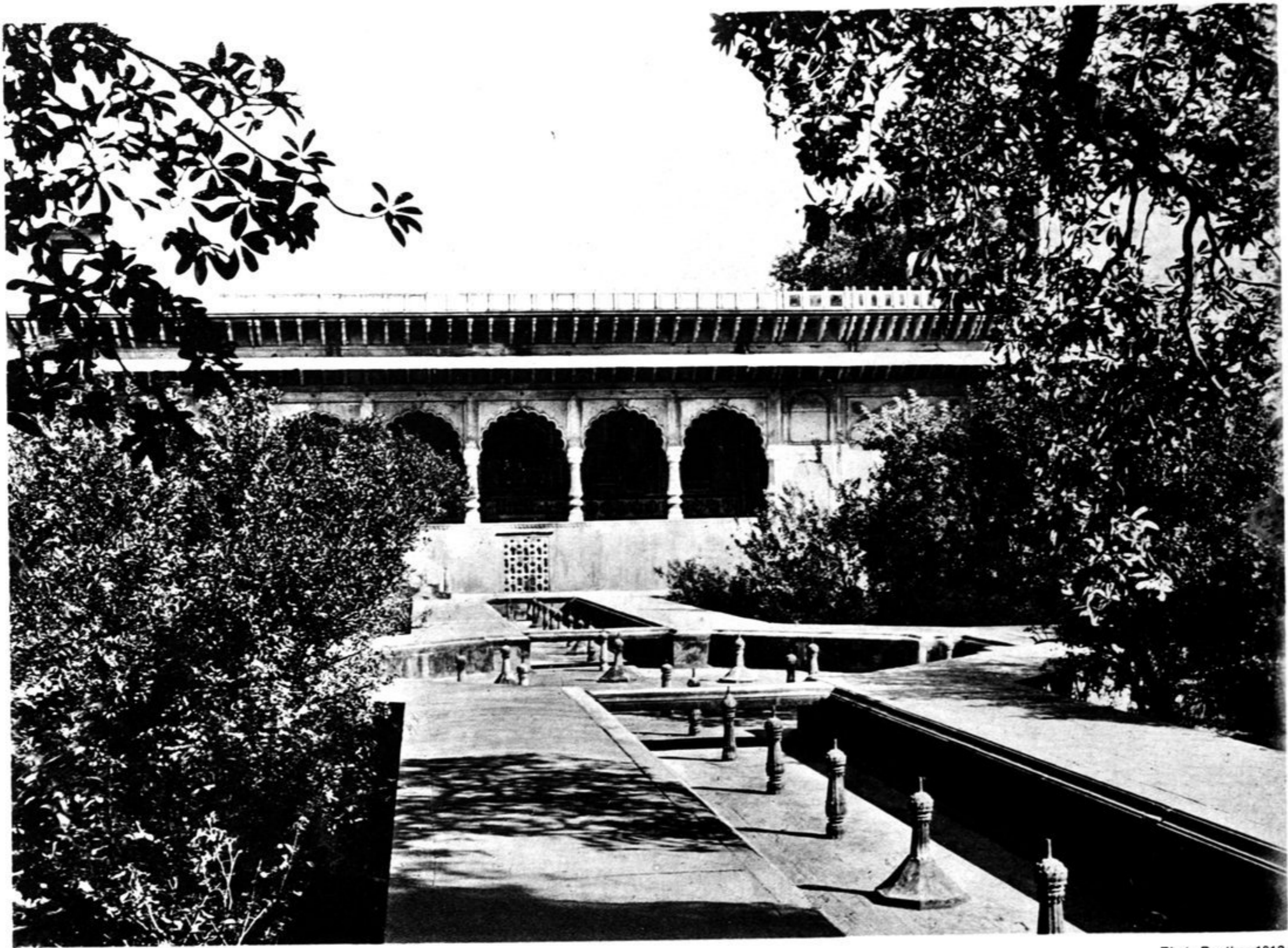
Suradsch Bhawan aus dem Garten des Hardeo Bhawan gesehen.