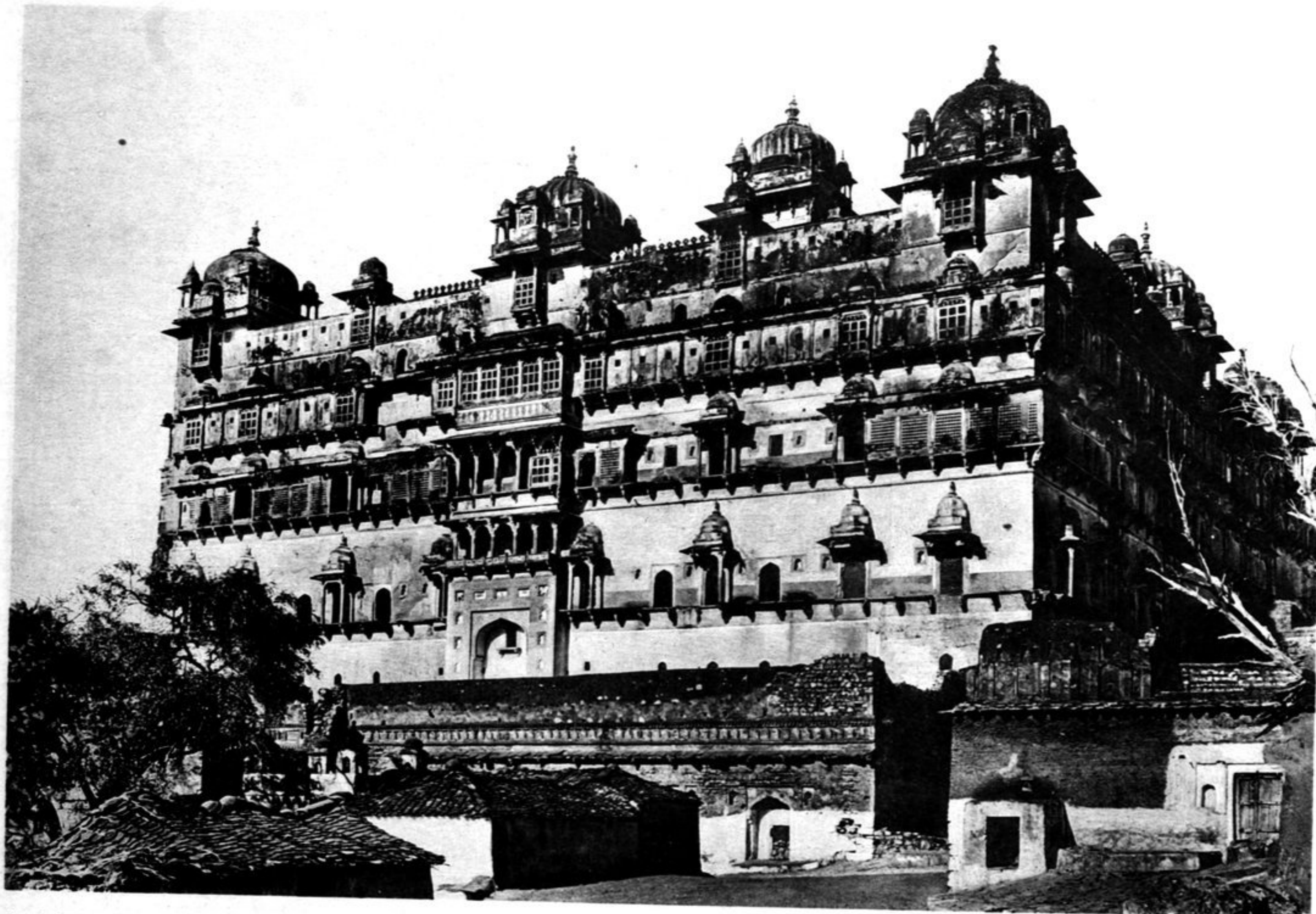
Ansicht von der Stadt.