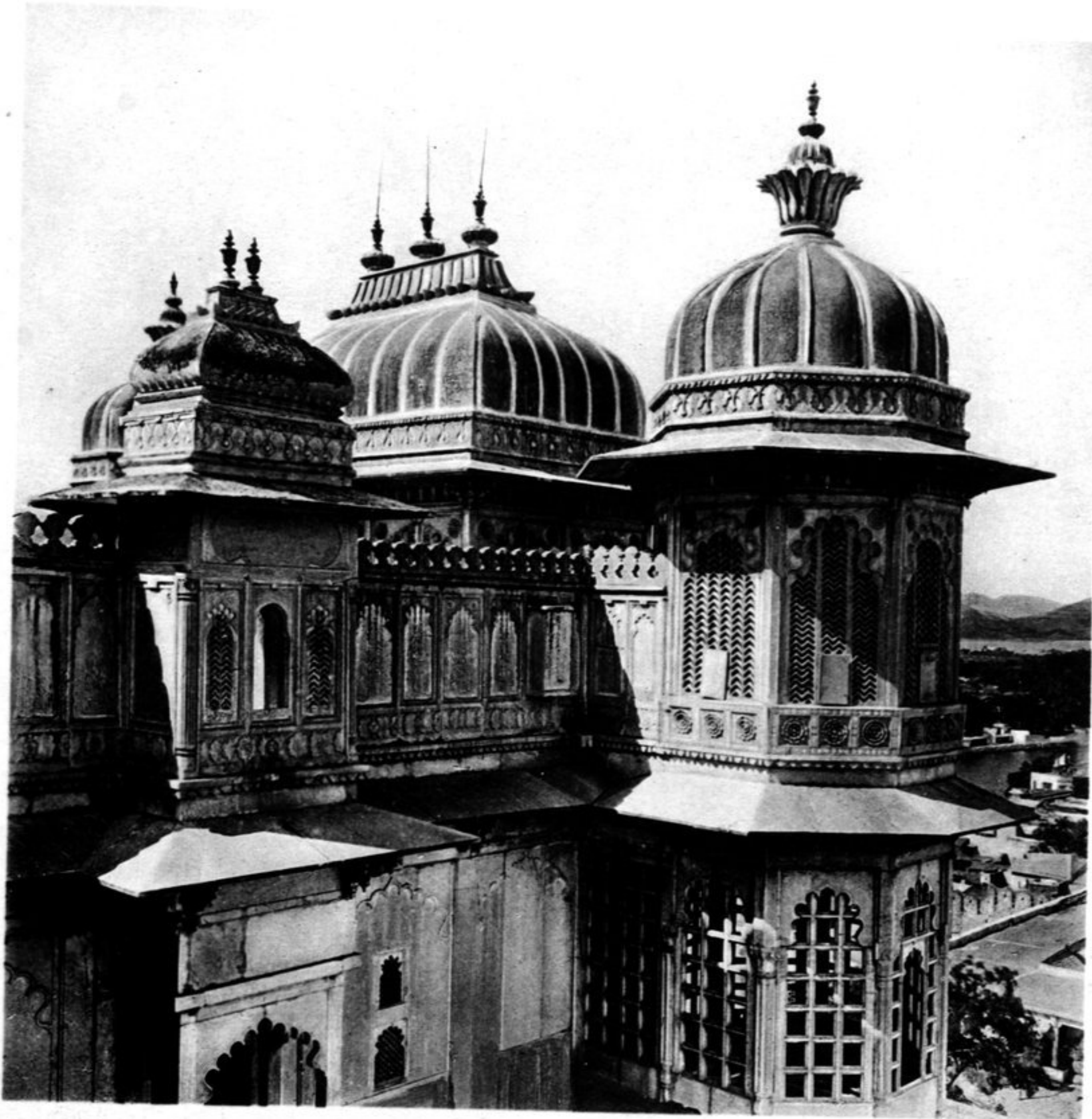
Obere Stockwerke des Bari Mahal (von Südosten gesehen).