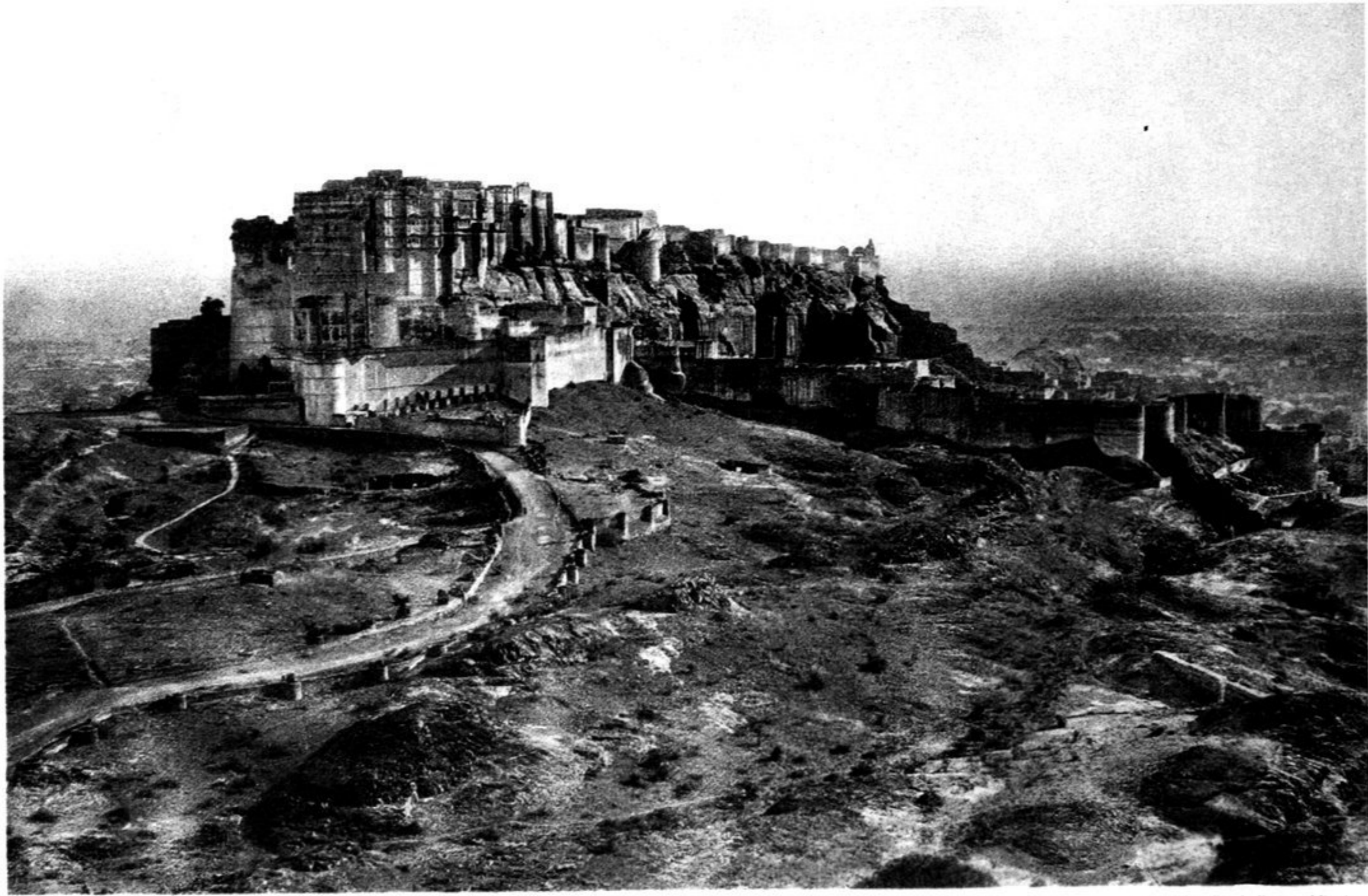
Die Burg von Südosten.