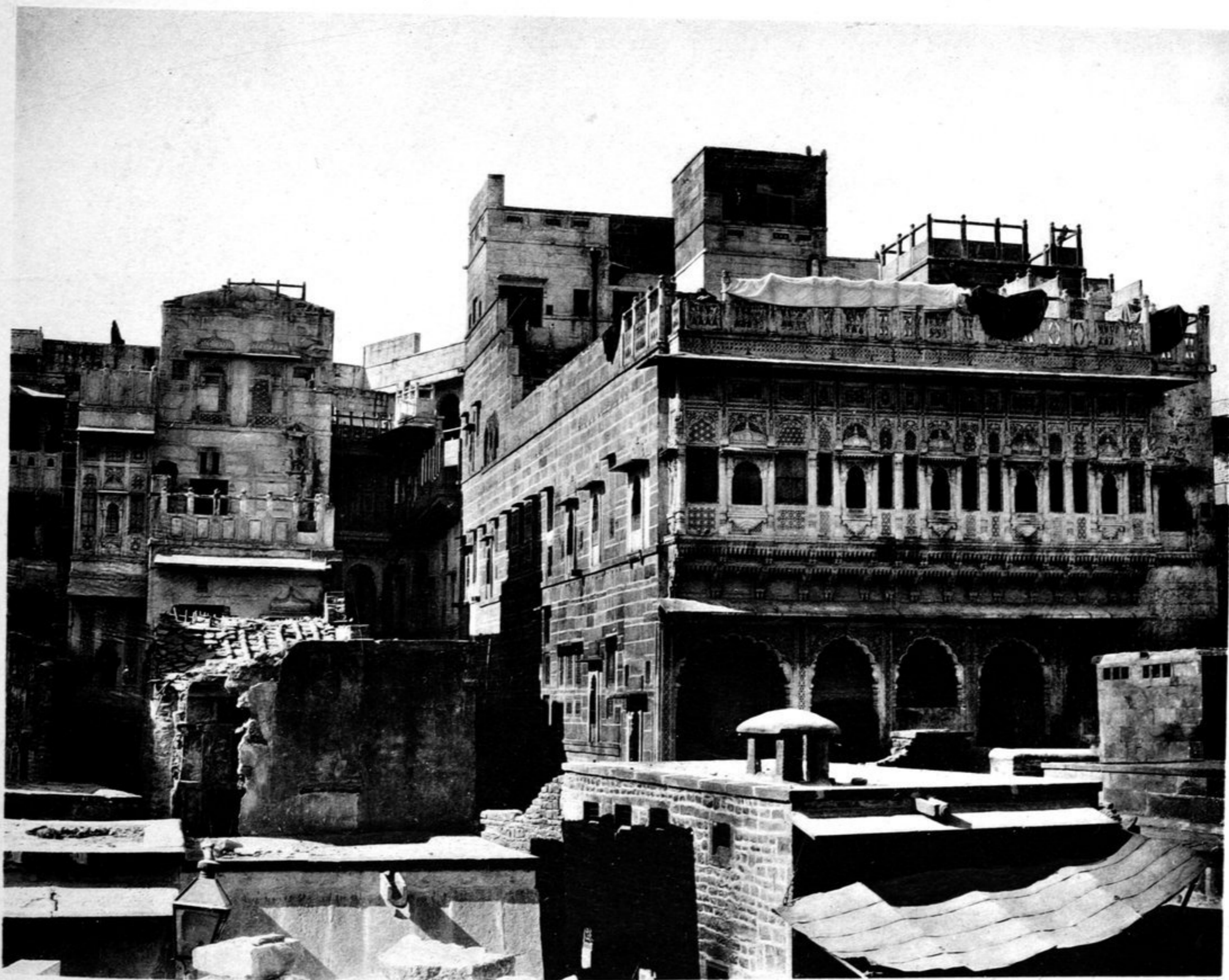
Haus eines Kaufmanns.