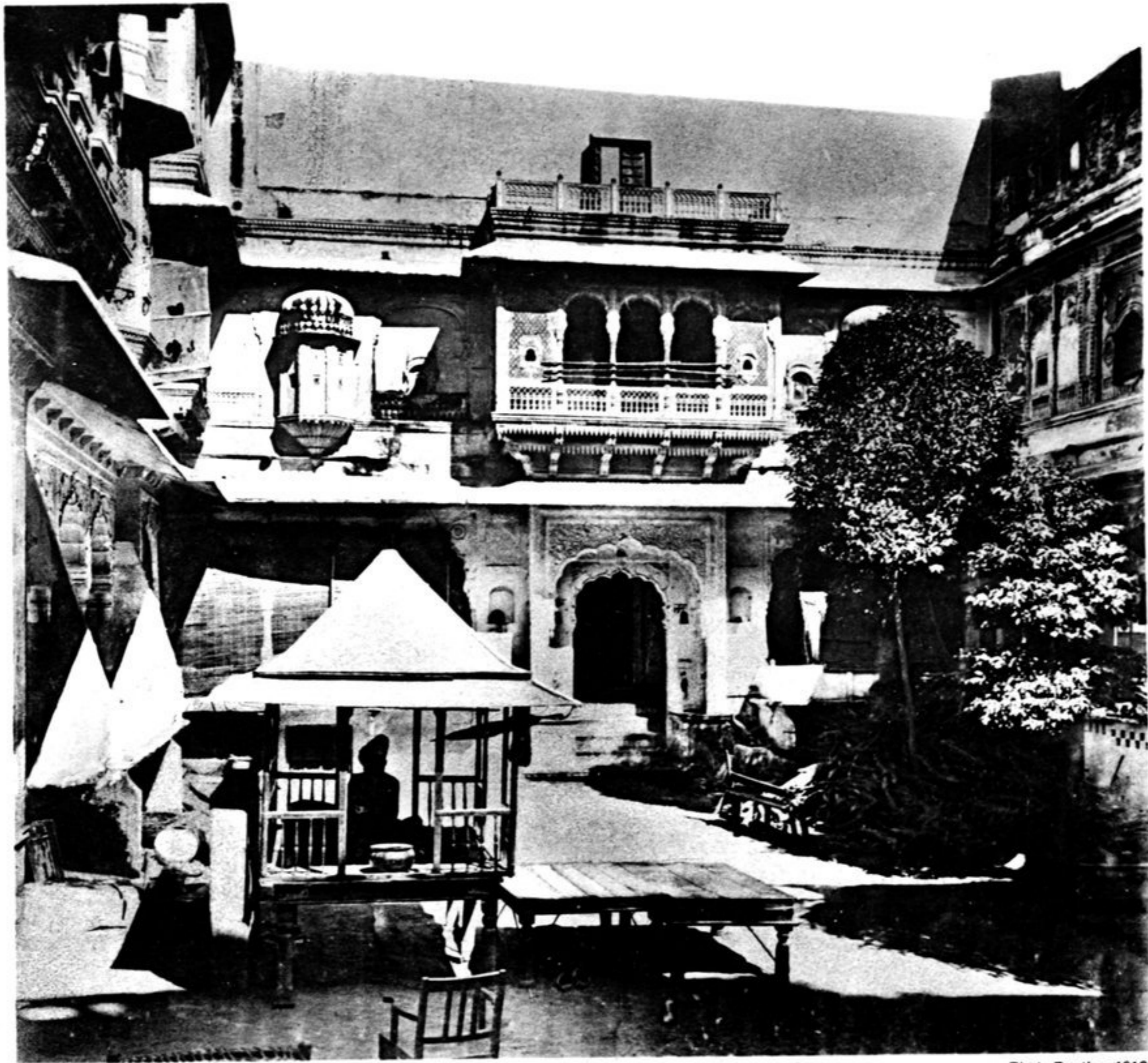
Mardanahof. Blick auf die Nordseite mit dem Portal nach dem Hof C.