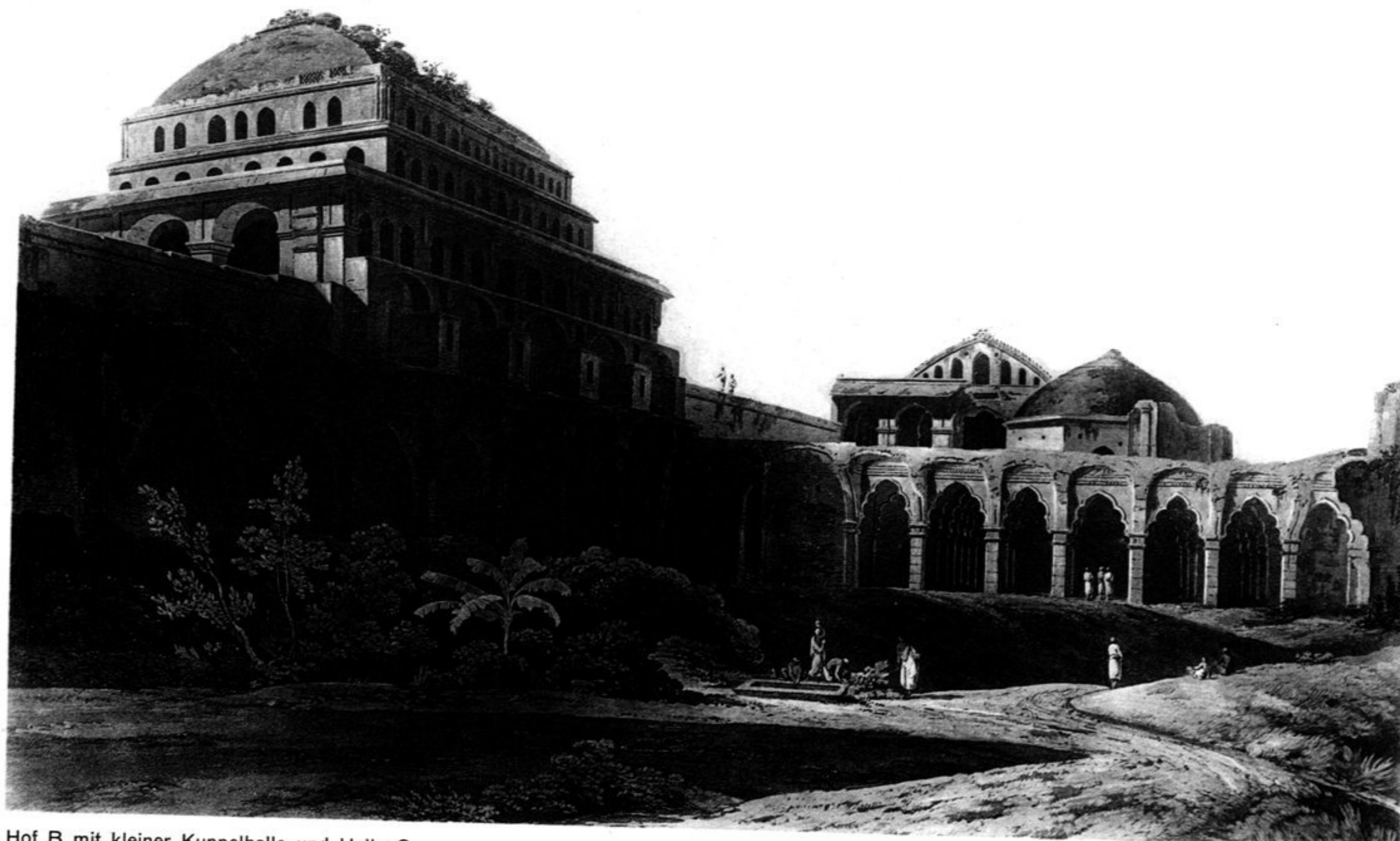
Hof B mit kleiner Kuppelhalle und Halle C.