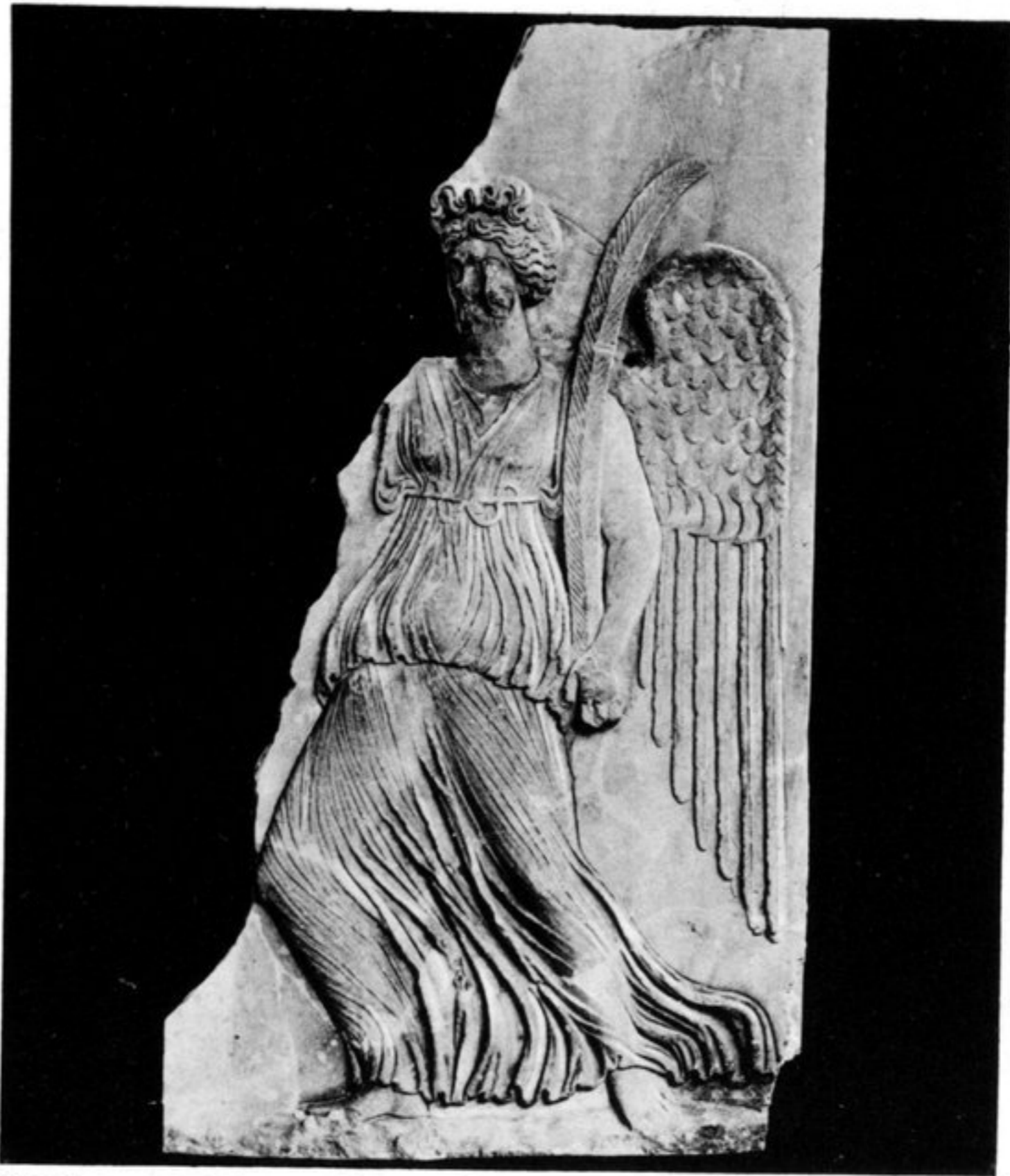
Nike vom Eivan Serai Qapusu, Osman. Museum zu Konstantinopel Nr. 667 (948)