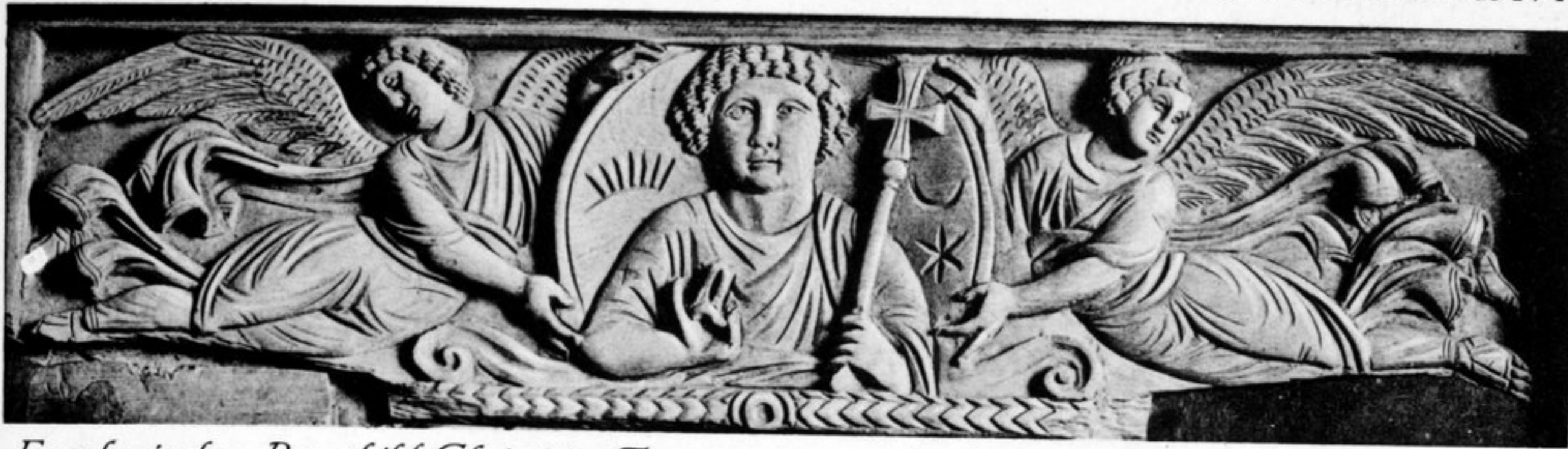
Engel mit dem Brustbild Christi im Firmament, vom Barberini-Diptychon, Louvre