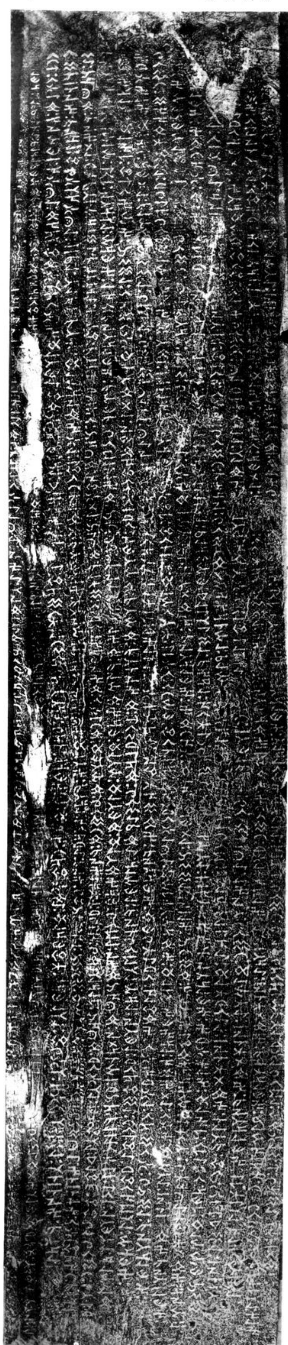
2 (K b.)

III. 1. 2. 3. 4. 5. 6. 7. 8. 9. 10. 11. 12. 13.