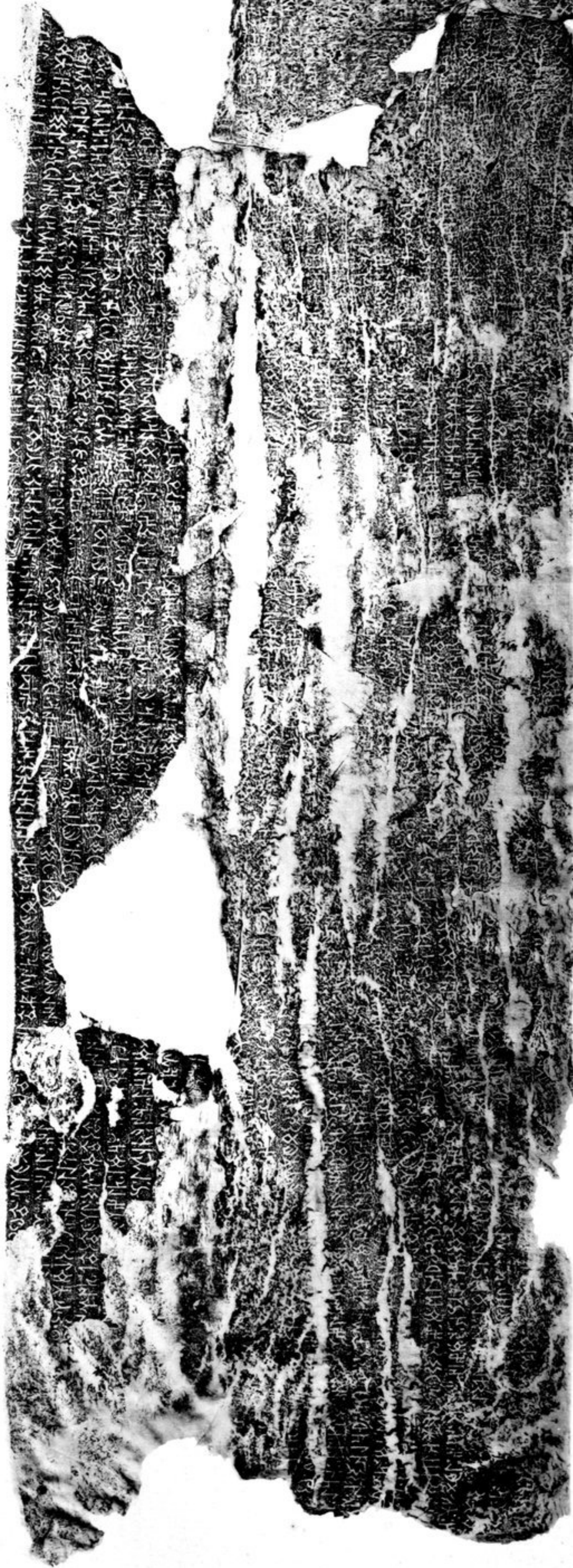
2 (X b.)