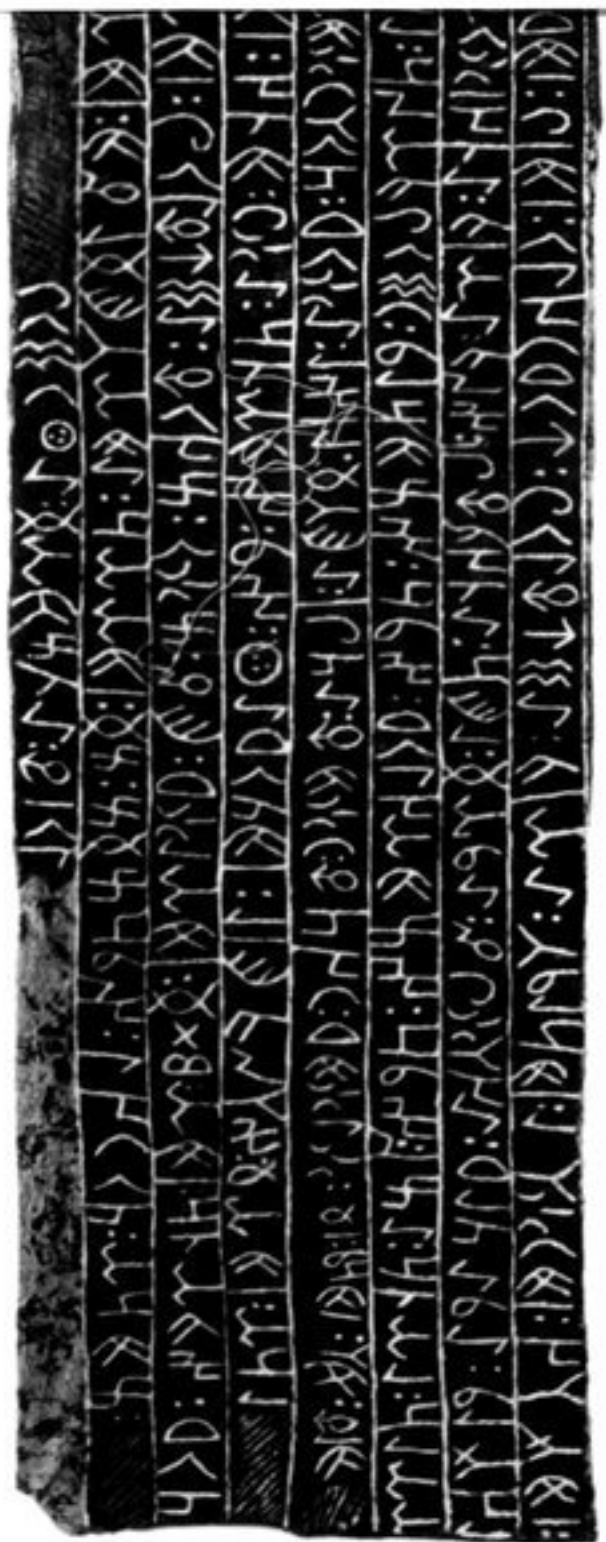
4 (O. a).