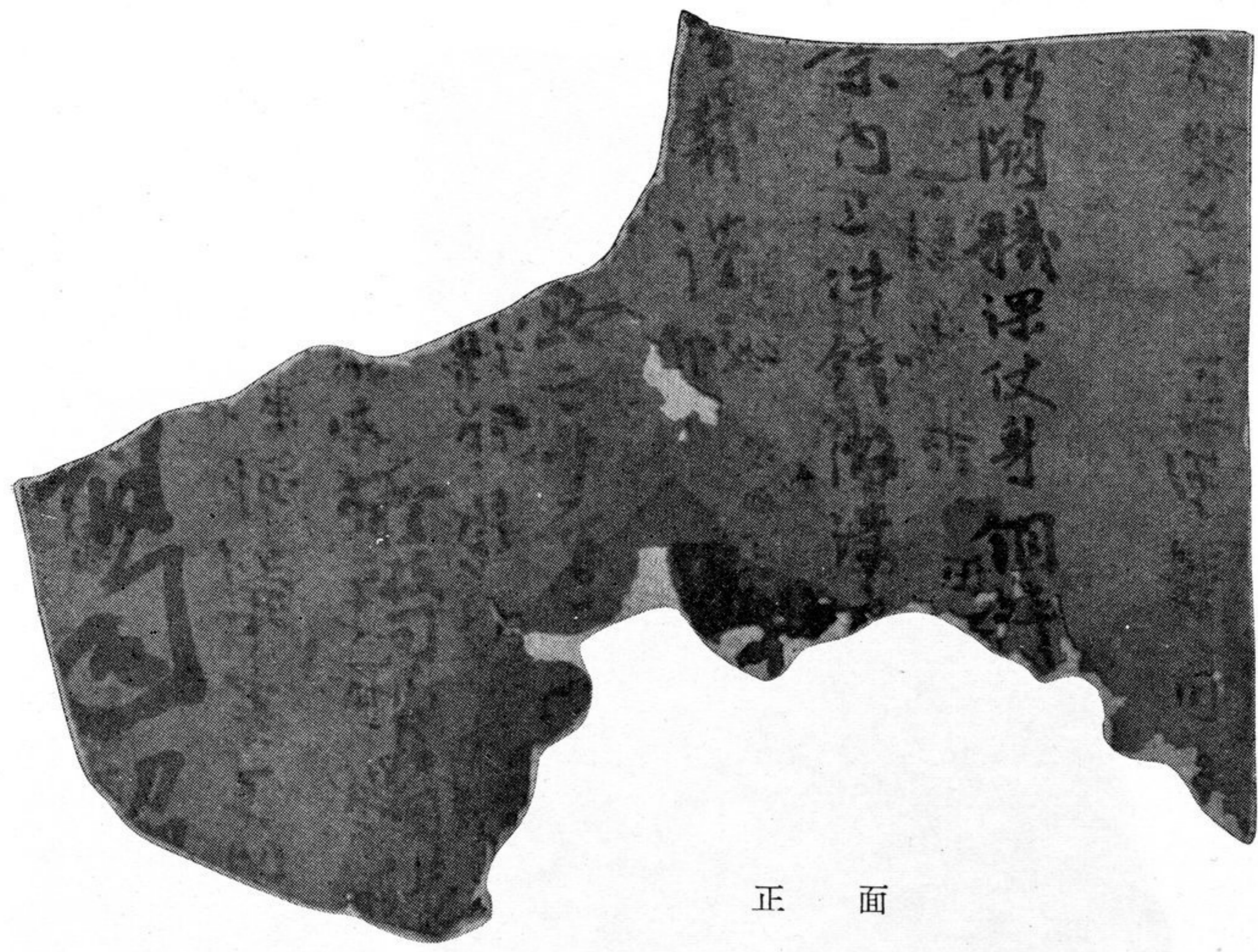
圖版一九、圖23 古文書寫本