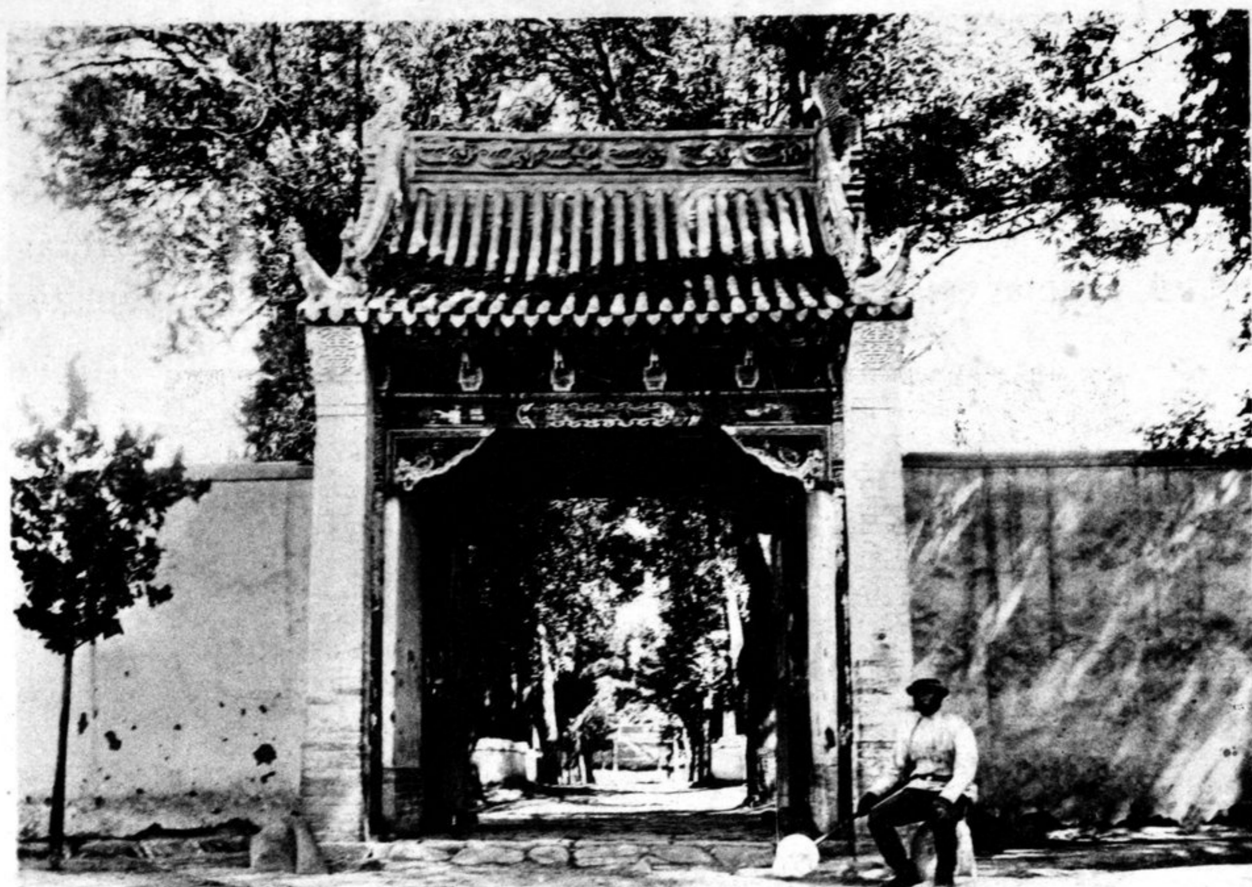
Парадные ворота в сад князя Ши-е