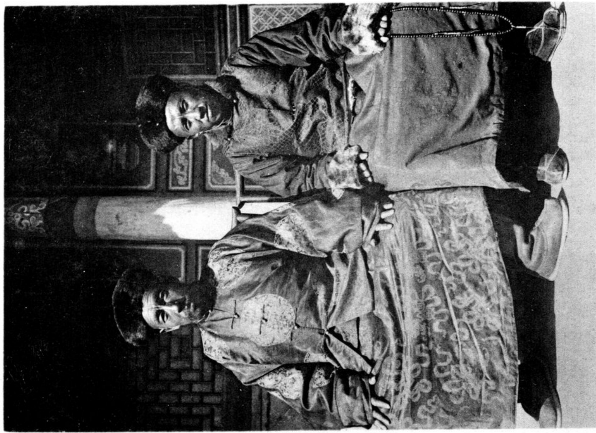
Лейб-медик Эмчи-хамбо и секретарь по китайским делам (оба состоят при Далай-ламе)