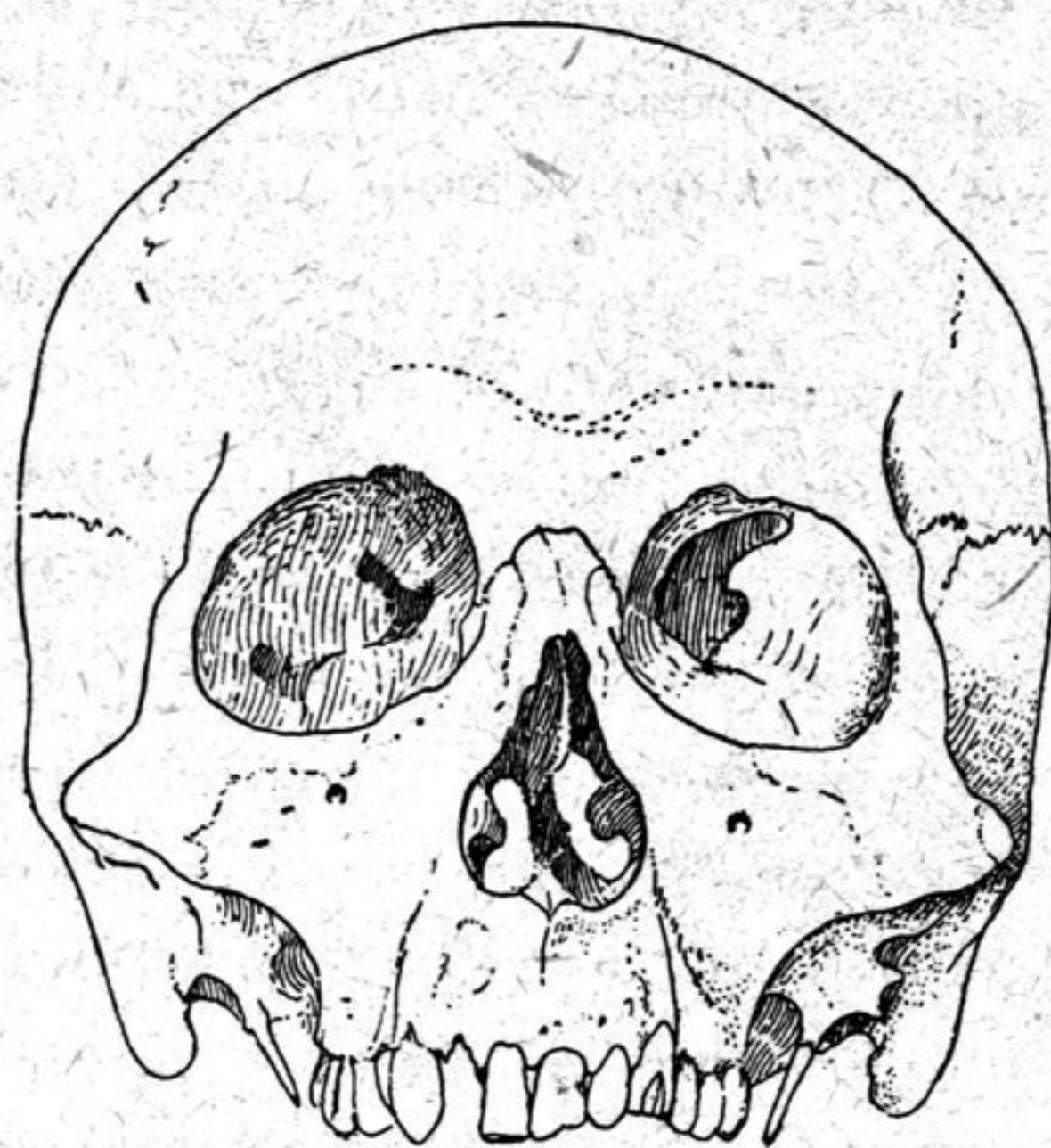
II. Череп из «знаменитого» субургана.