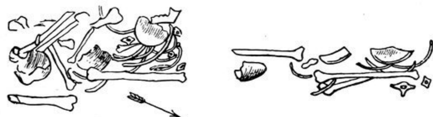
Abb. 24. (N:o 1 von oben und von der Seite).