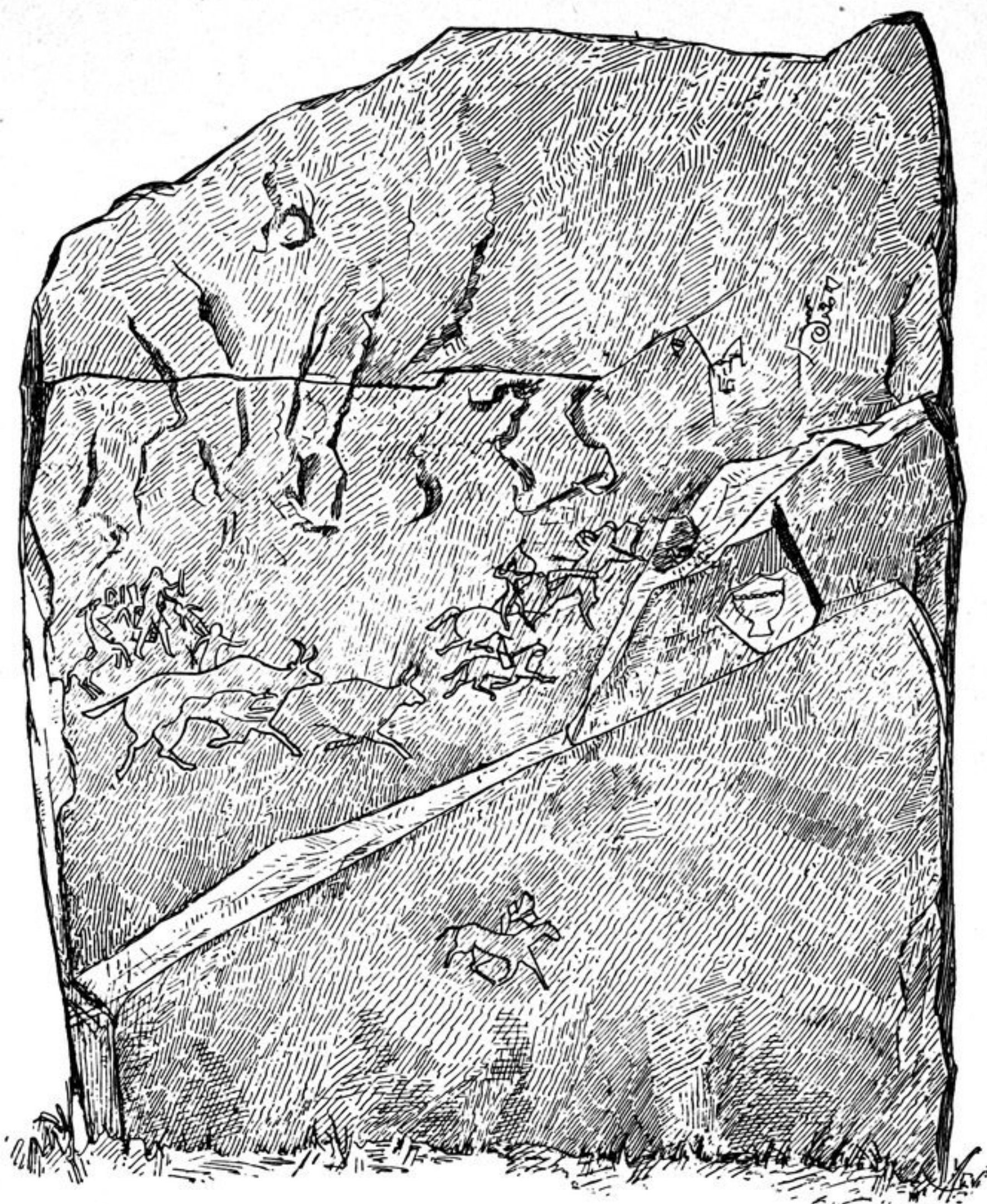
Abb. 96. Podkamen. Grabstein I.