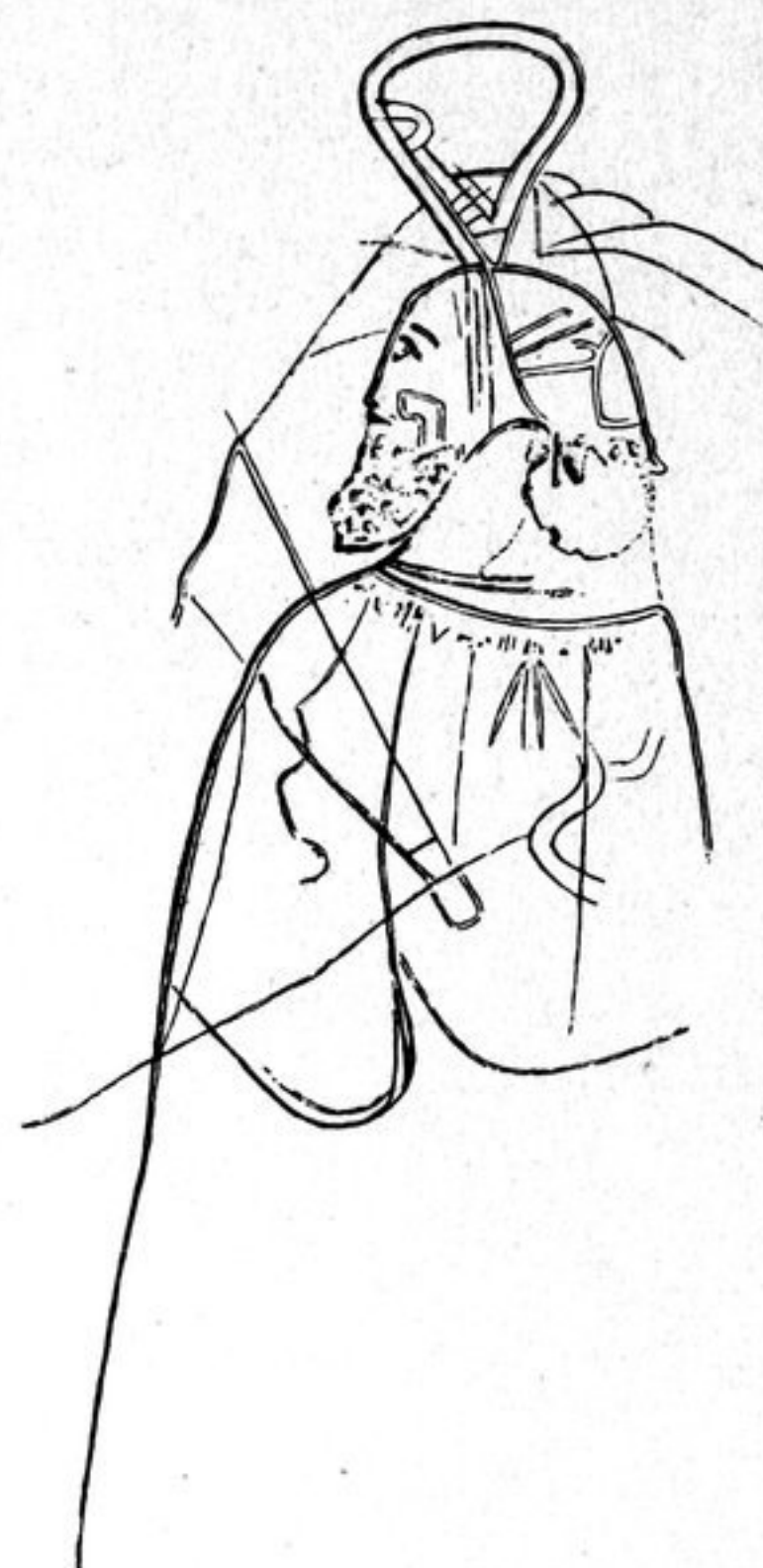
Abb. 98. Priesterfigur auf Stein I. — \frac{3}{4} .