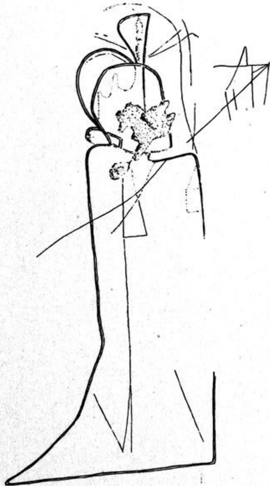
Abb. 102. Priesterfigur auf Stein II. — \frac{3}{4} .