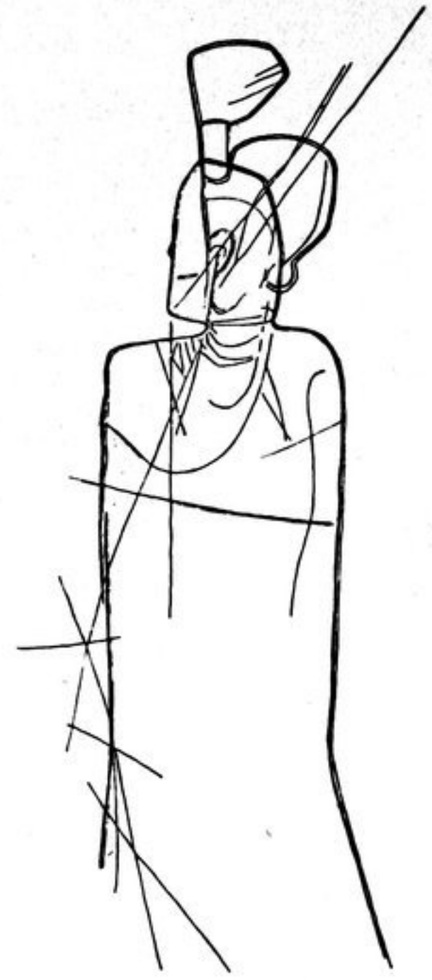
Abb. 101. Priesterfigur auf Stein II. — \frac{3}{4} .