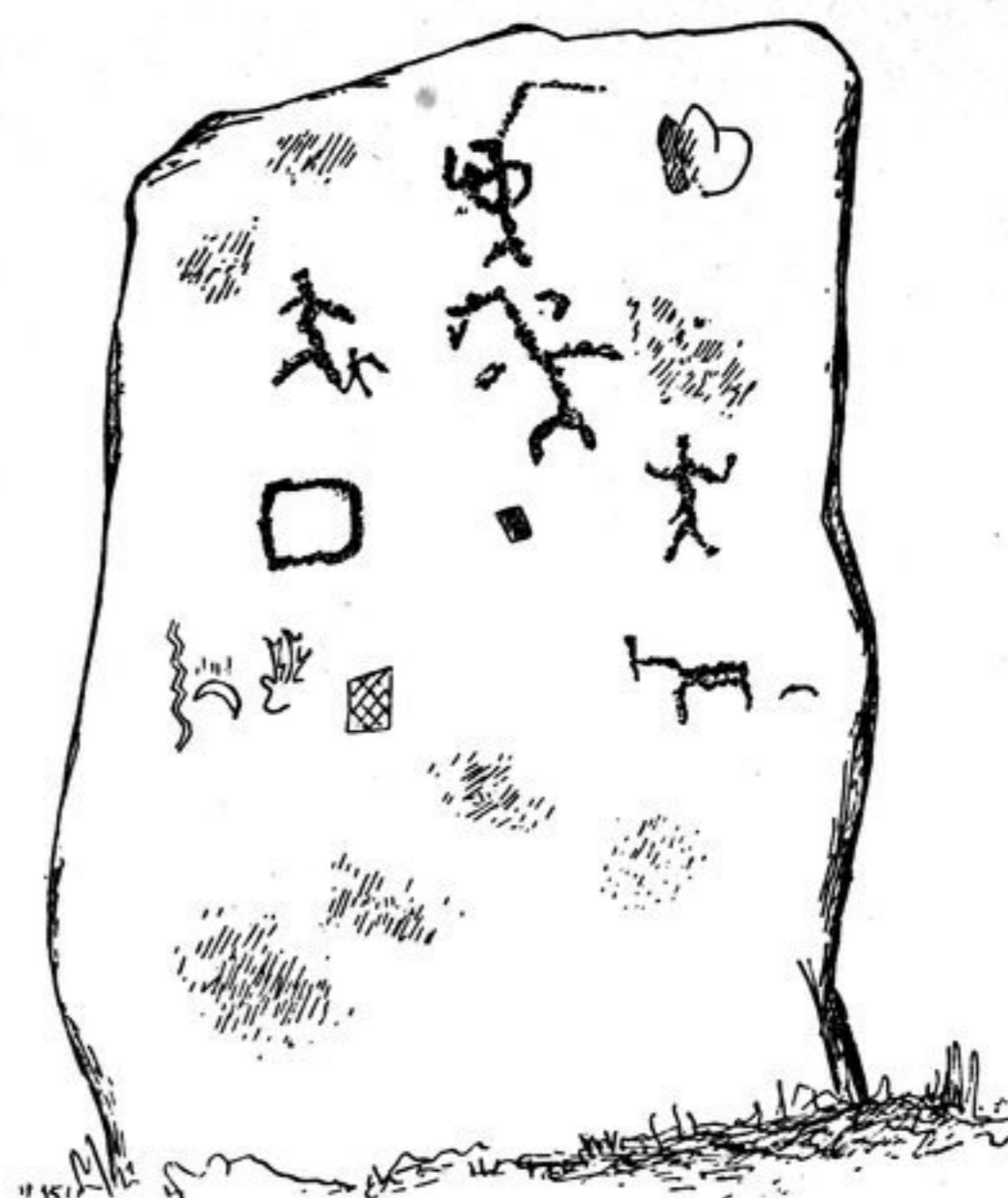
Abb. 107. Kostischewo.