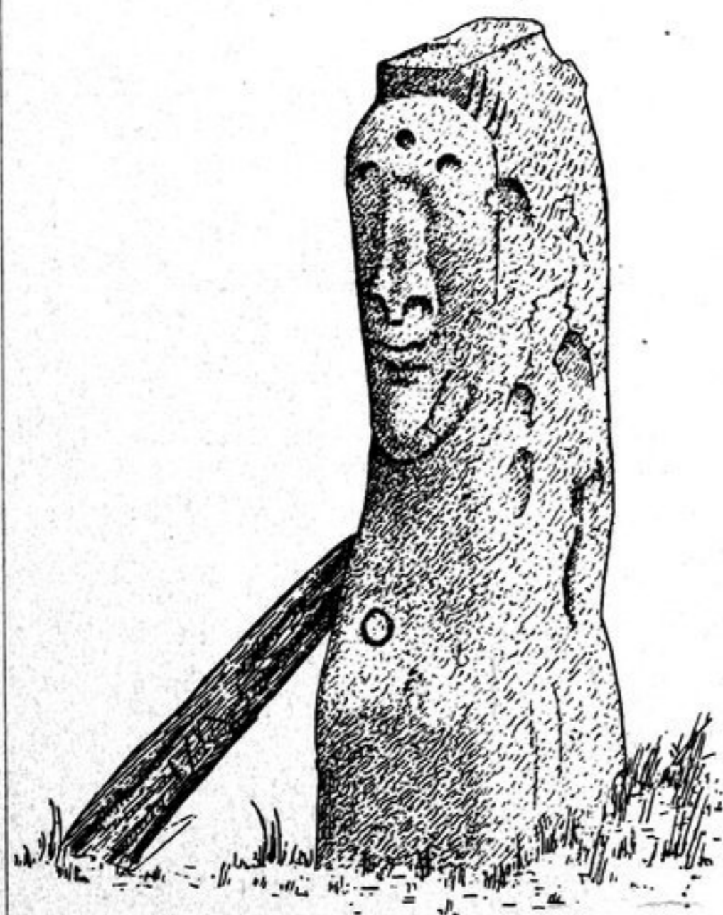
Abb. 108. 7 Werst südlich von Farpus.