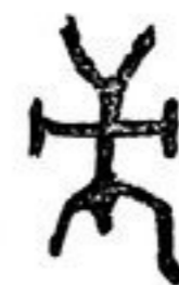
Abb. 106. Figur auf einem Grabstein bei Kostischewo.