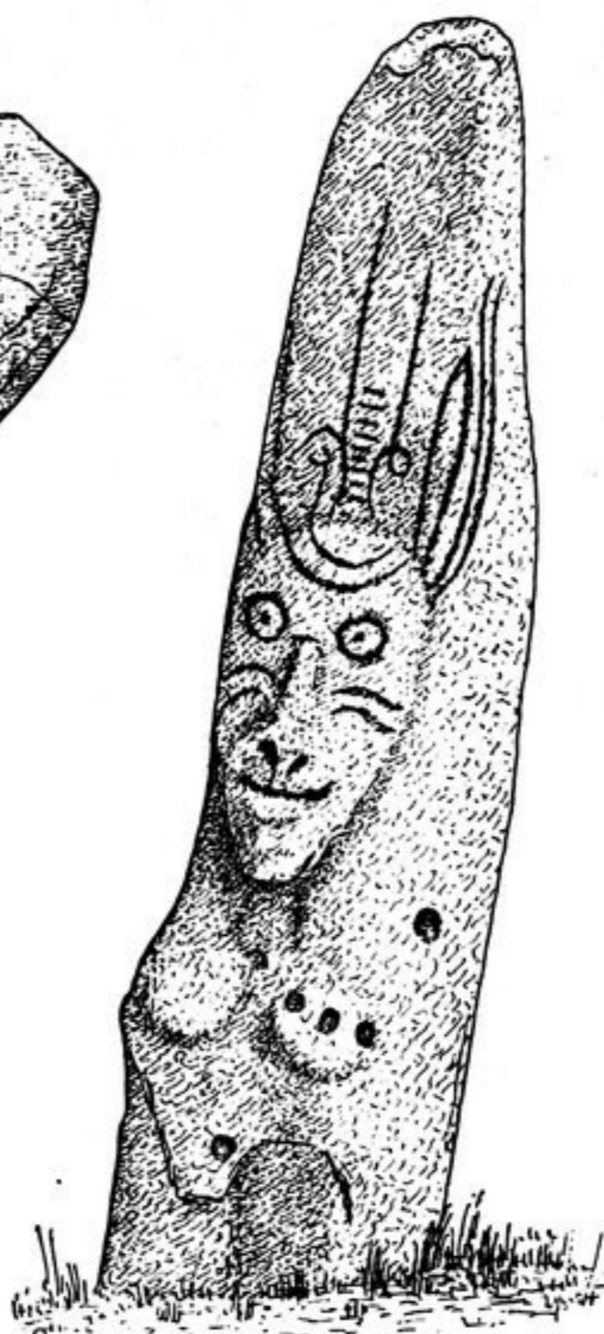
Abb. 105. Batanakowo.