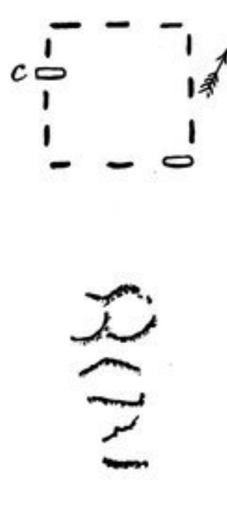
Abb. 209, 210.