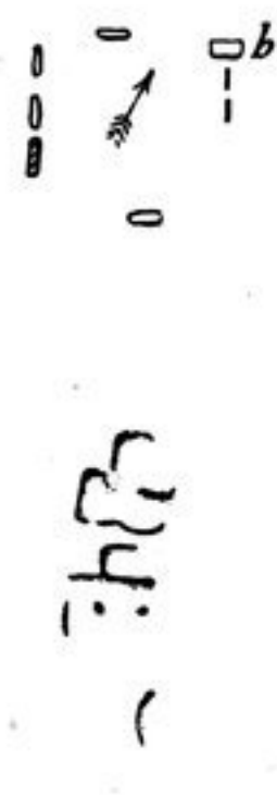
Abb. 207, 208.