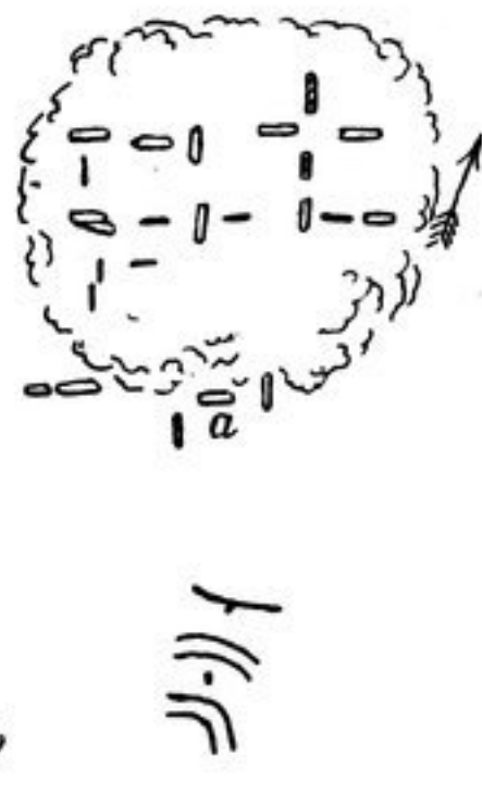
Abb. 205, 206.