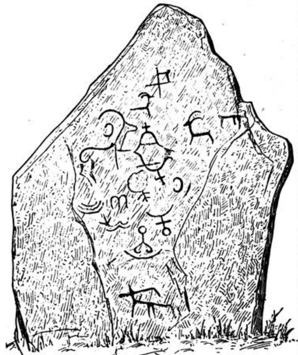
Abb. 214. 7 Werst von Askys.