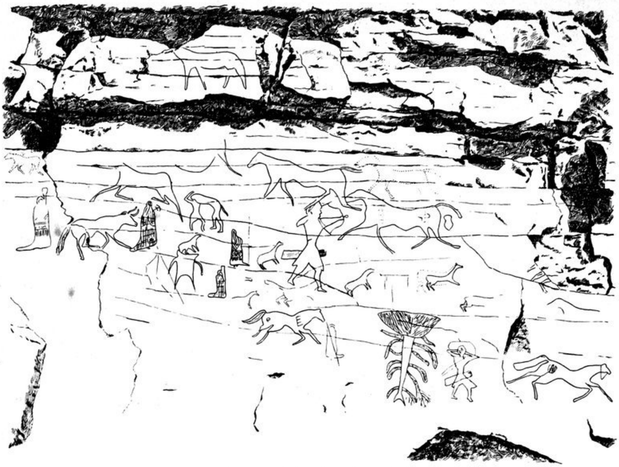
Abb. 302. Felsenzeichnung auf dem Argoberge, 8 W. von Podkamen.