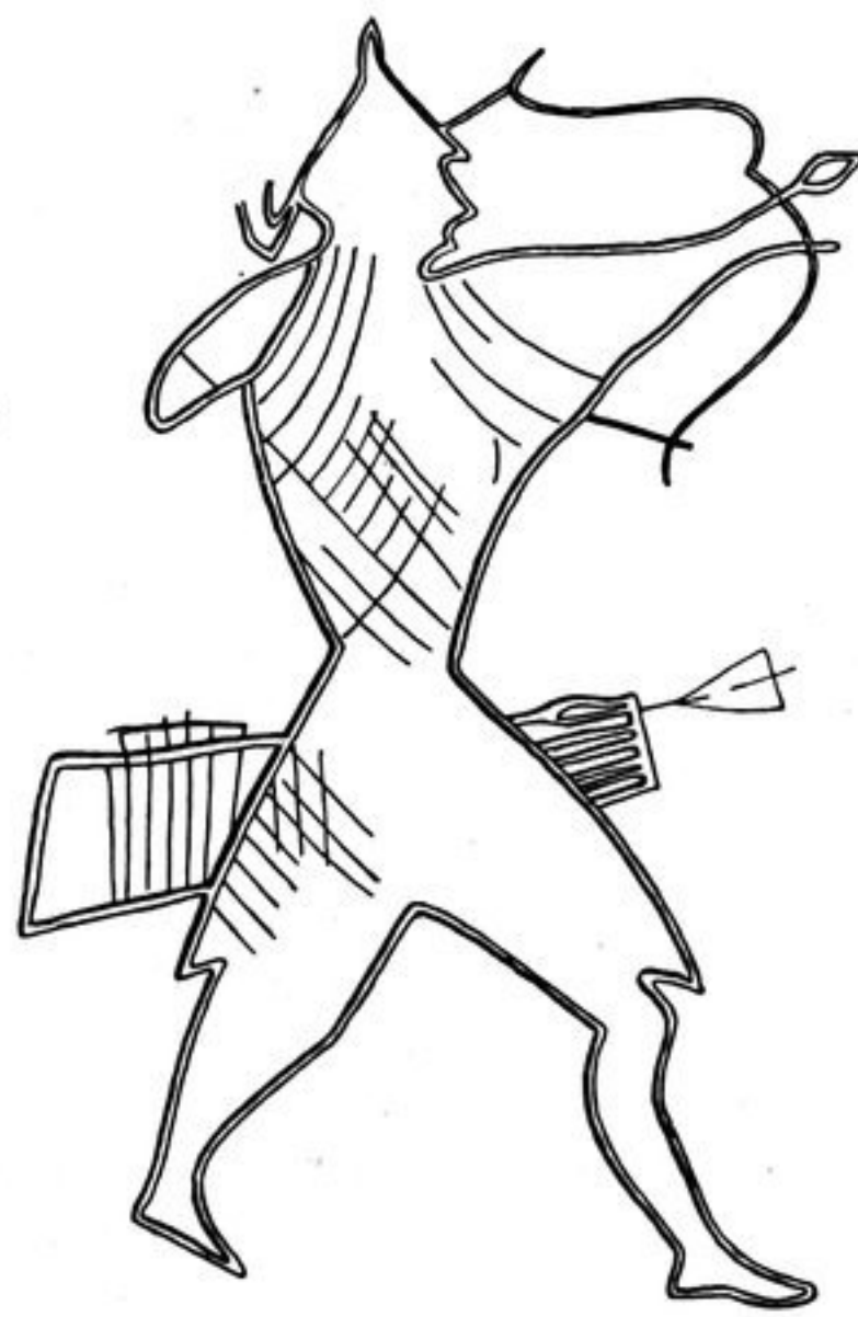
Abb. 307. - 1/4.