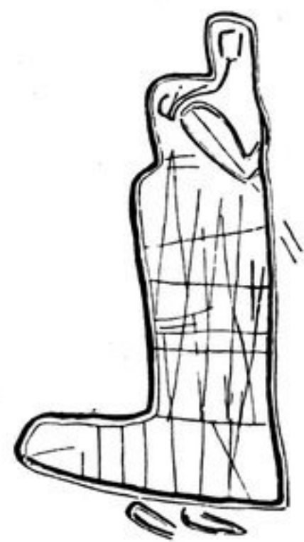
Abb. 306. - 3/4.