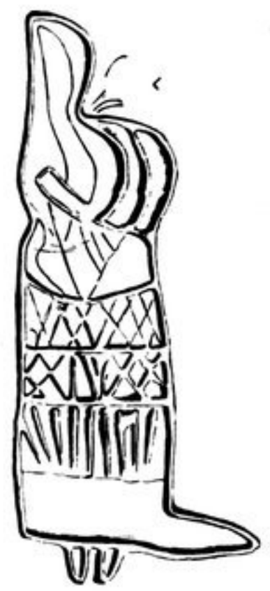
Abb. 305. - 3/4.