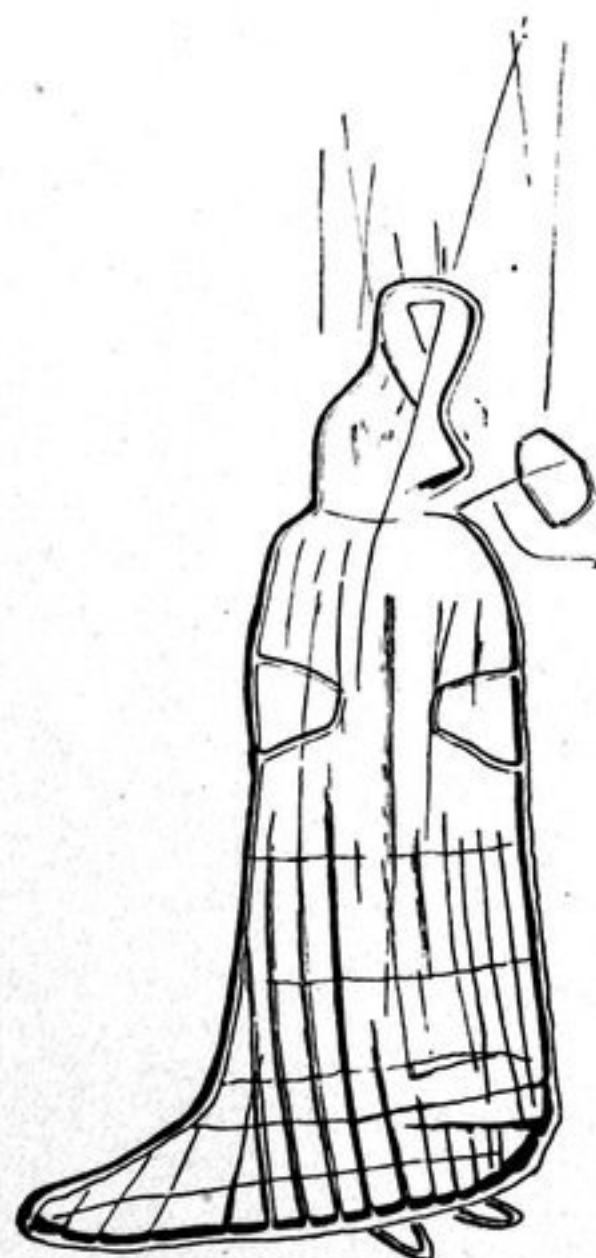
Abb. 304. - 3/4.