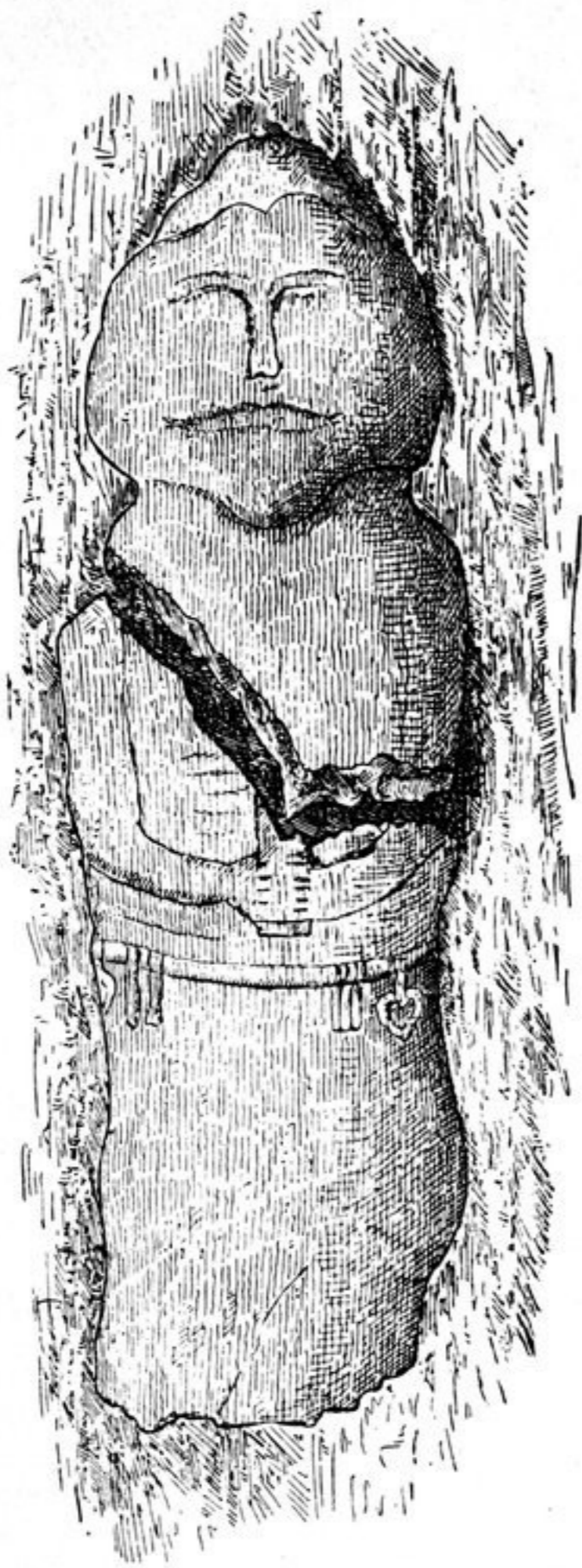
Abb. 333 A. Bildstein in der Gegend von Tschakul zwischen dem Kemschik und dem Ulukem.