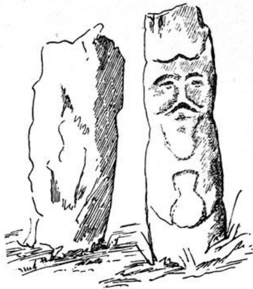
Abb. 333. Bildstein bei Dschaganar. Ulukem.