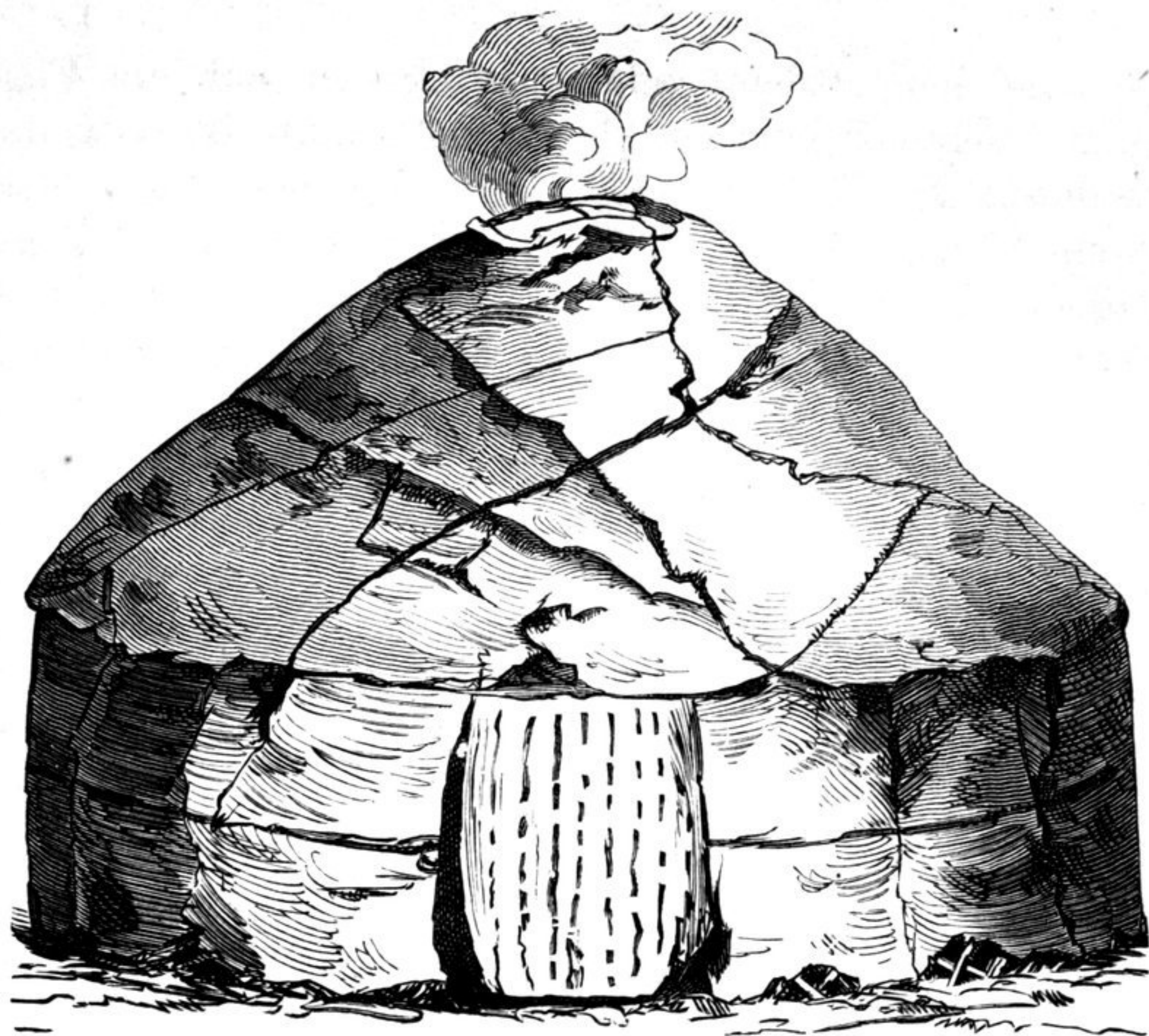
Altajische Gitter-Jurte mit Filzbekleidung.