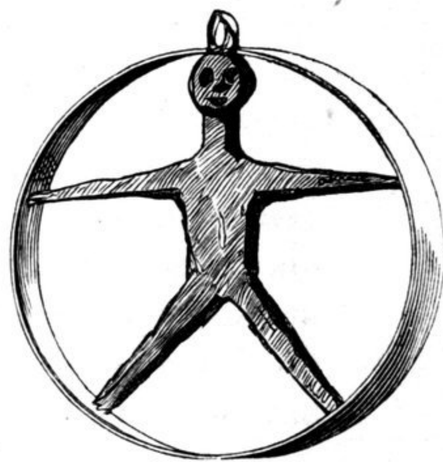
Götzen der Altajer.