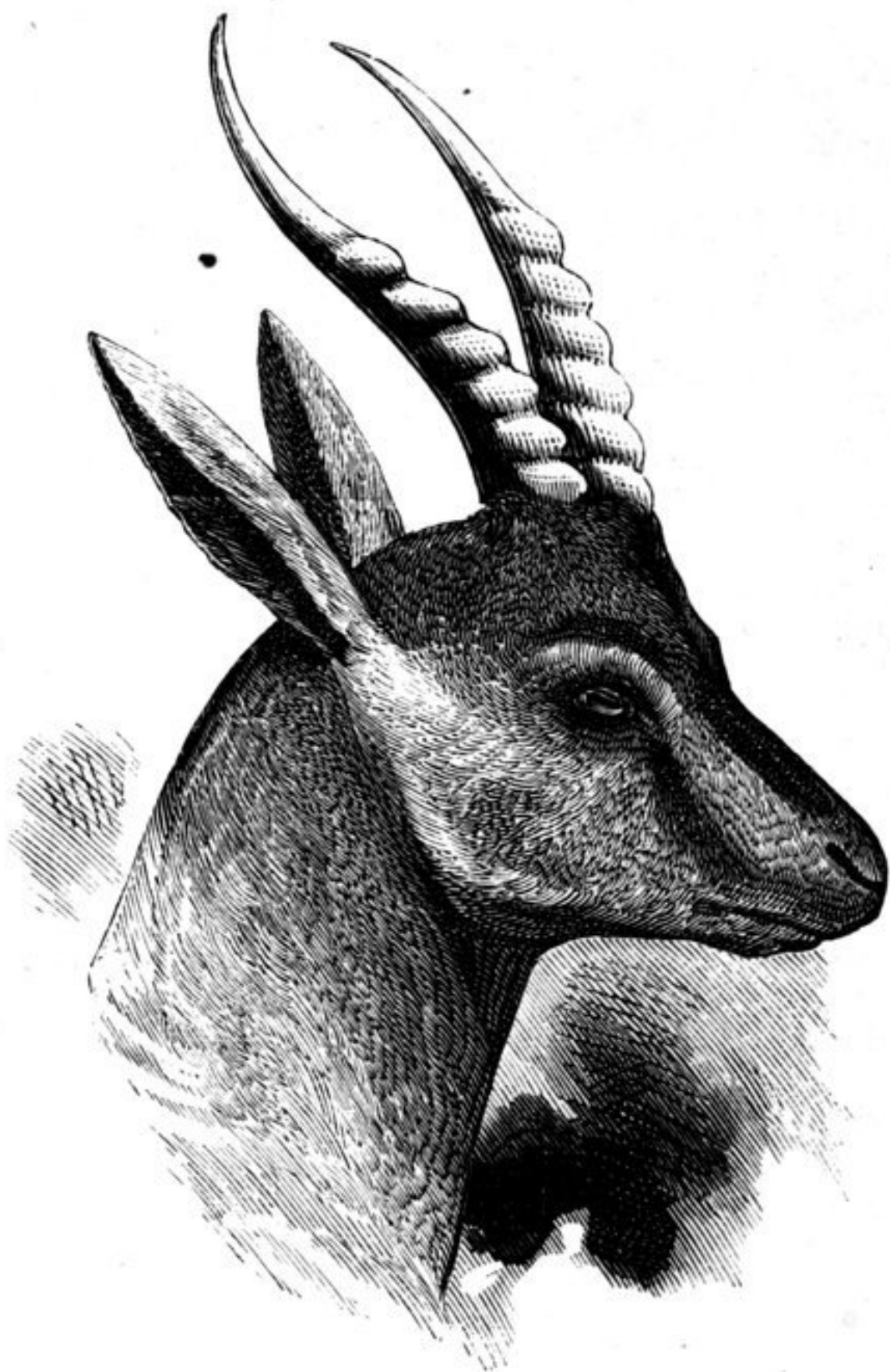
Хара-сультъ ( Antilope subgutturosa ).

сульта ( Antilope subgutturosa ), свойственная всѣмъ вообще пустынямъ Центральной Азіи, но вездѣ не особенно обильная 1) ; антилопа сайга ( Antilope saiga ) обитающая, и въ достаточномъ числѣ, лишь въ западной части Чжунгарской пустыни; два вида песчанокъ ( Meriones ), многочисленныя въ песчаныхъ буграхъ; дикій верблюдъ ( Camelus bactrianus, ferus ), живущій также въ пескахъ южной части пустыни; наконецъ три вида однокопытныхъ: джигетай ( Asinus hemionus ), хуланъ (вѣроятно Asinus onager ) и дикая лошадь ( Equus Przewalskii n. sp. ). Изъ перечисленныхъ животныхъ самыя замѣчательныя, конечно, дикій верблюдъ и дикая лошадь. Немного ниже о нихъ будетъ сказано подробно.