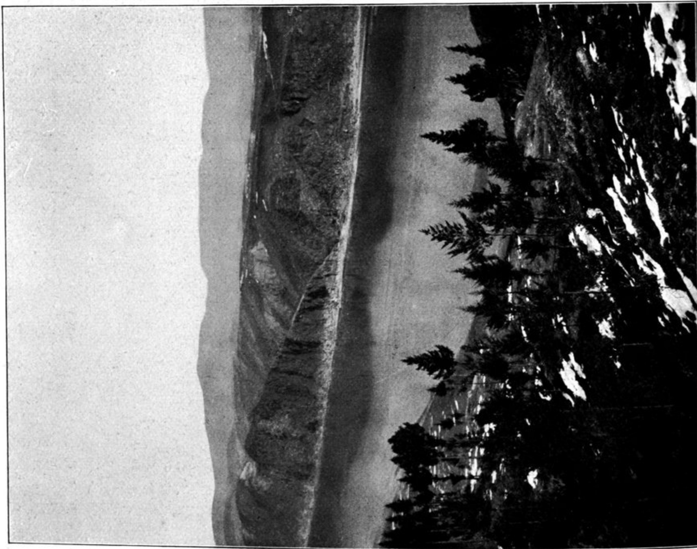
Der Han kiang unterhalb Kün tschou. (Der Fluß ist in einem Tal im Tale eingelassen.)