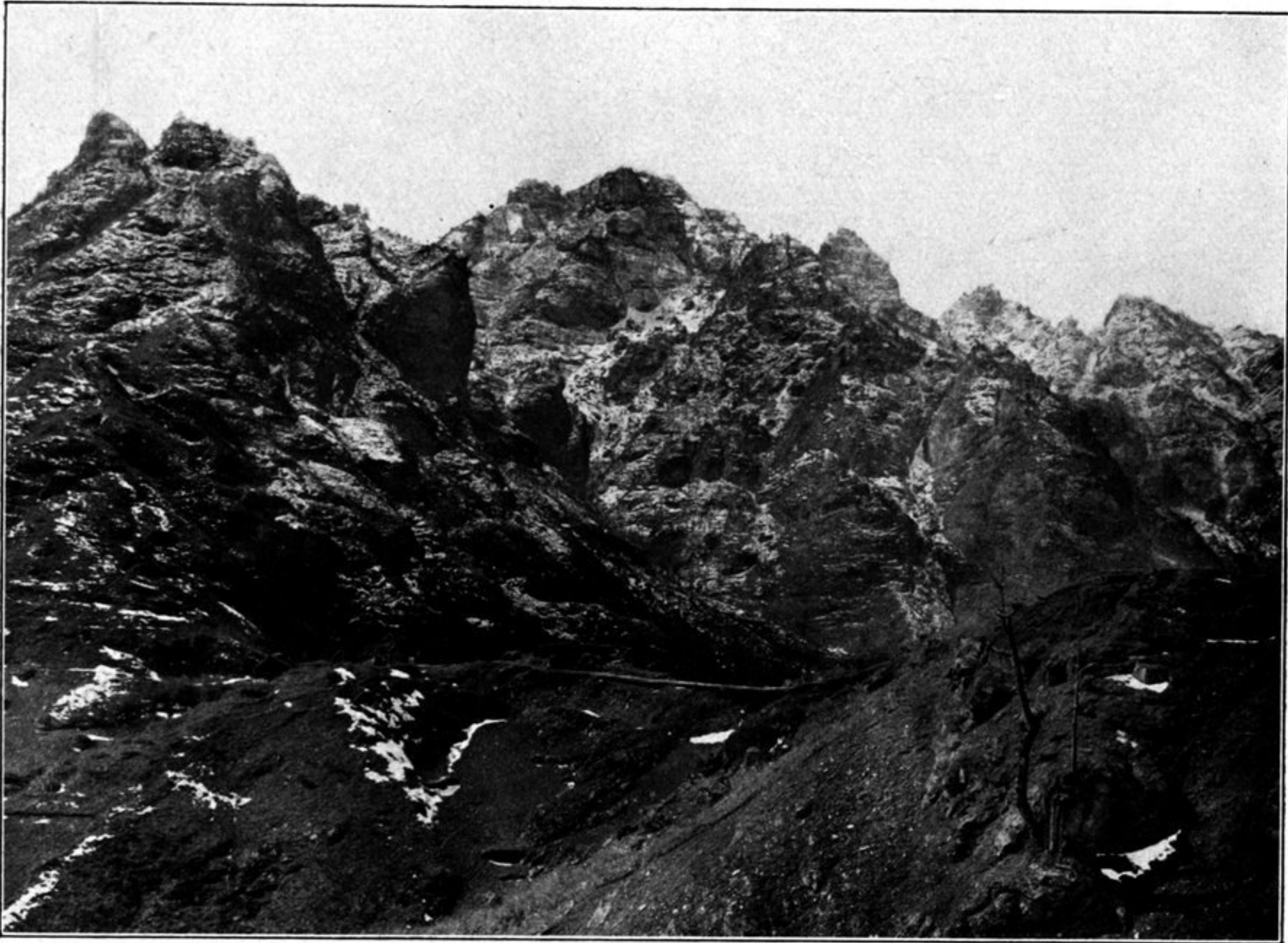
Gipfeltürme des Wu dang schan vom Wu ya ling gesehen.