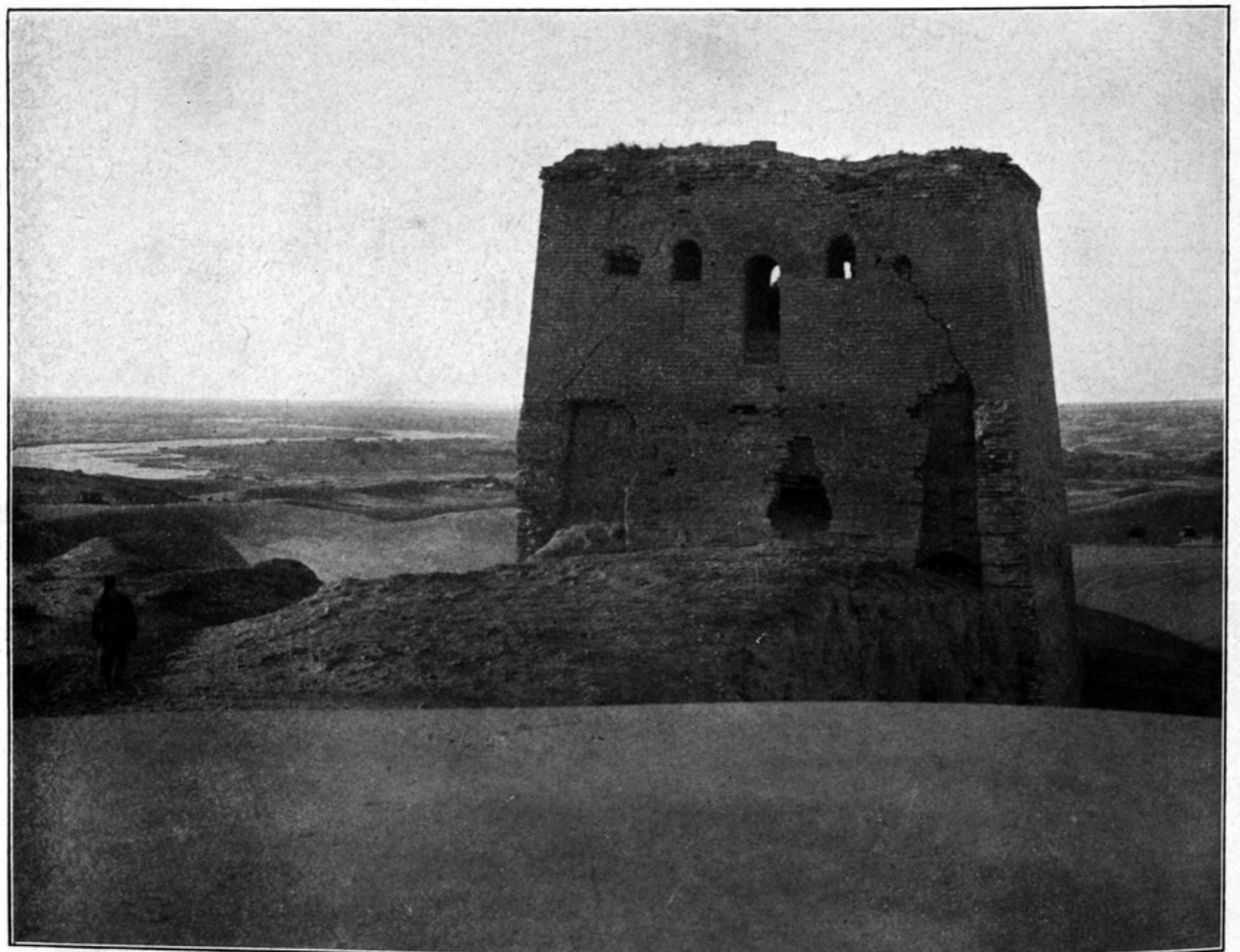
Wachtturm der großen Mauer bei Yü lin fu.