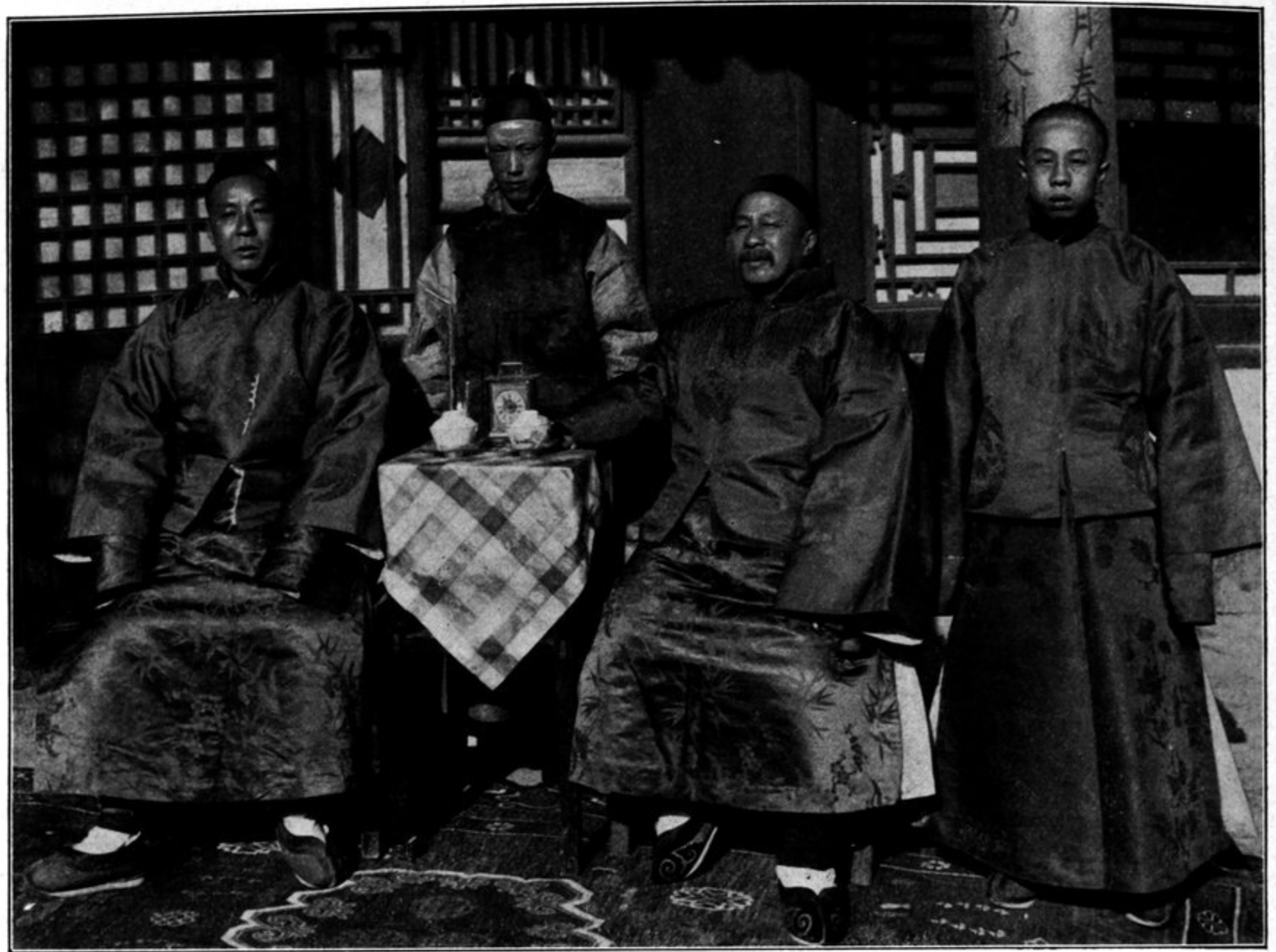
Der Hsi ning hsien, sein Bruder und Sohn.