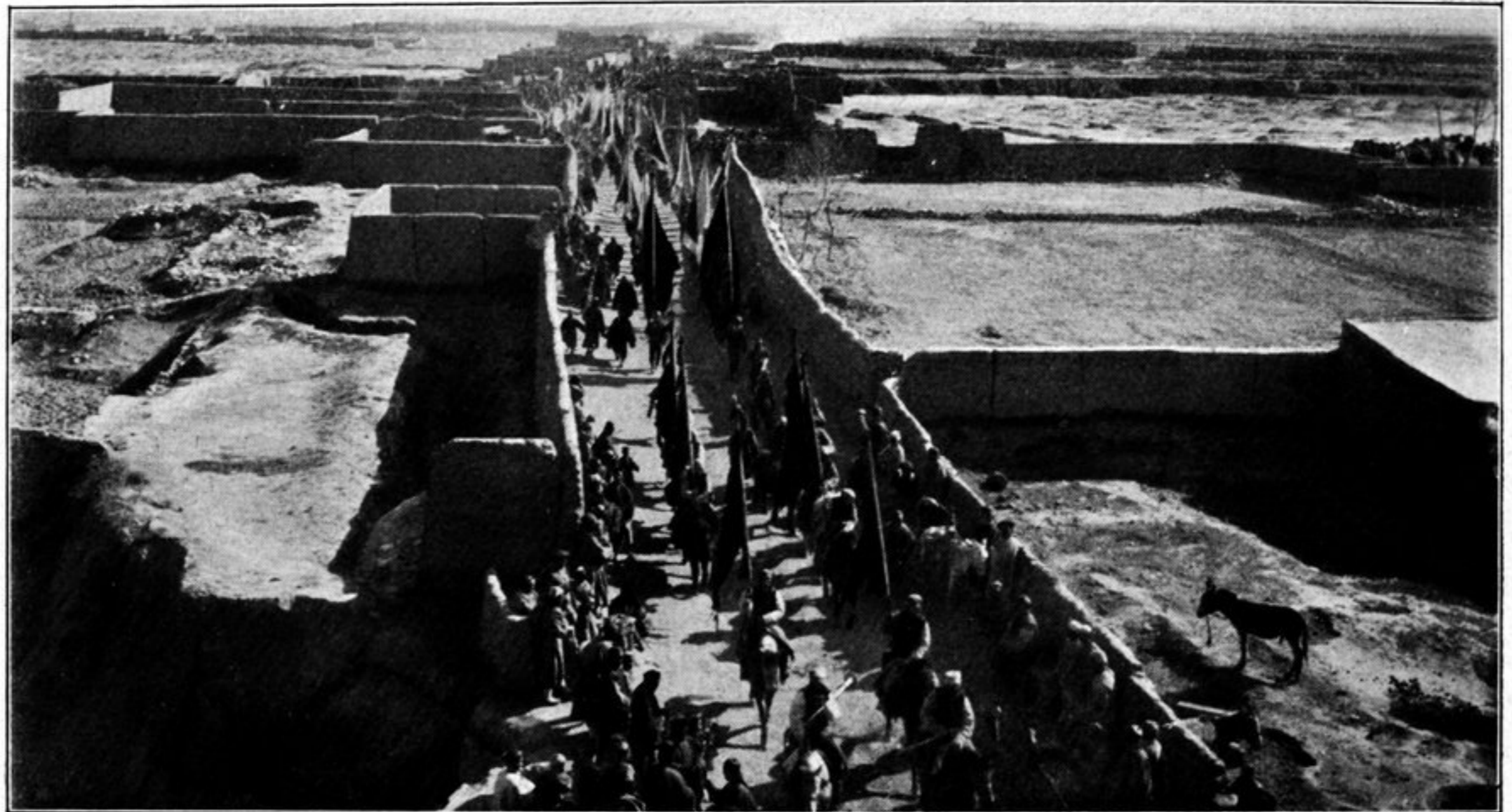
Rückkehr der Truppen vom Frühlingsfest in Hsi ning fu.