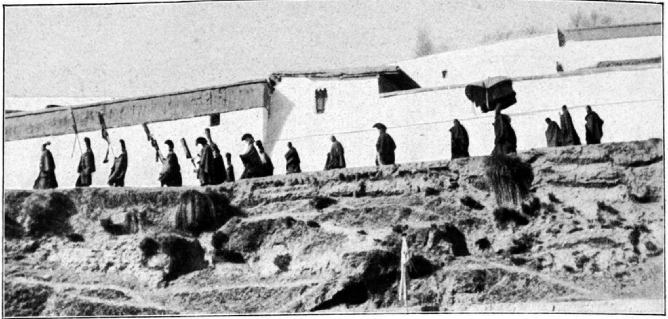
Der Kambo, der Klosterabt, von Gum bum begibt sich täglich zum Gebet in den Tsogs kang.