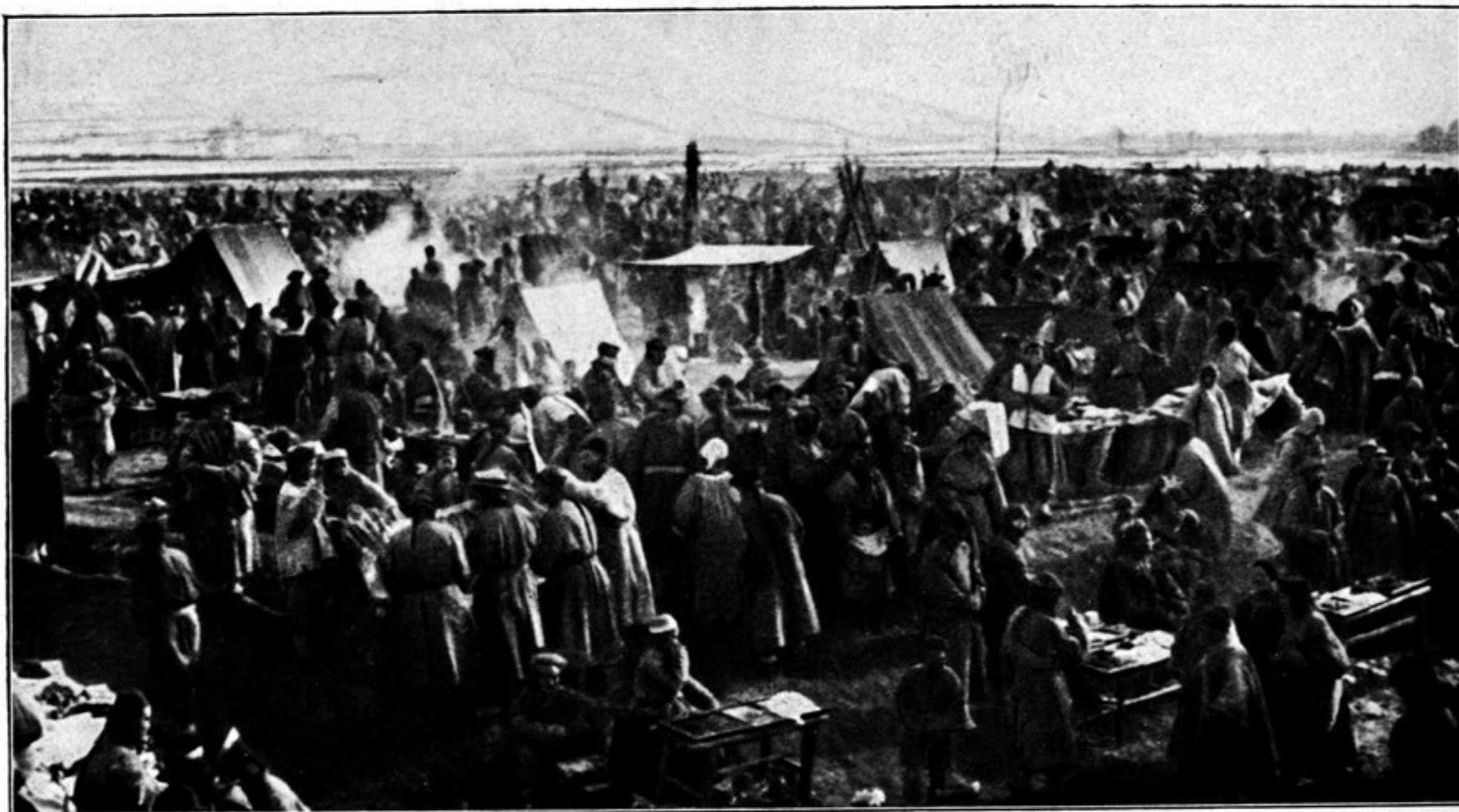
Die Messe in Wei yüan bu.