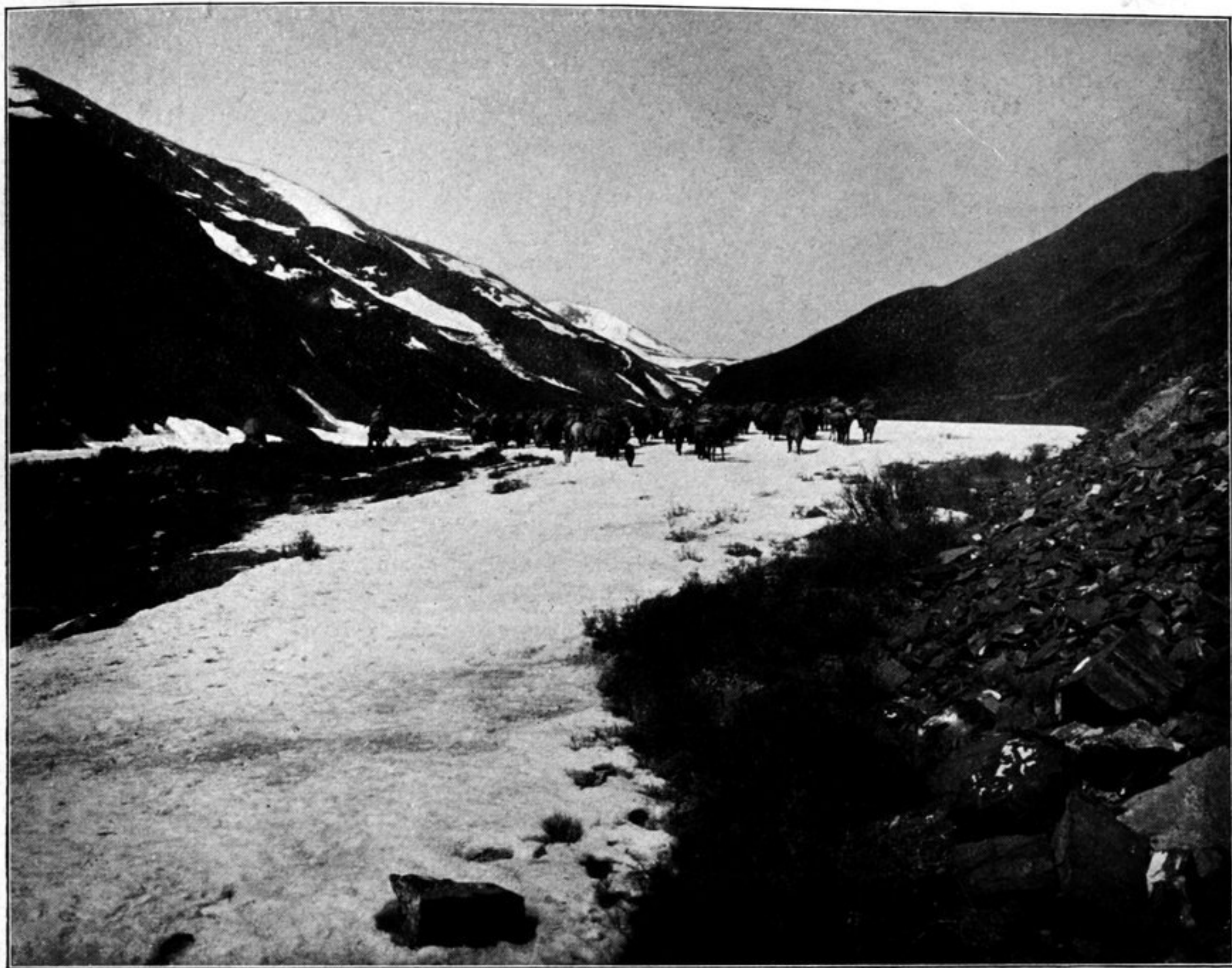
Meine Karawane unterwegs im Süd-Kuku nor-Gebirge.