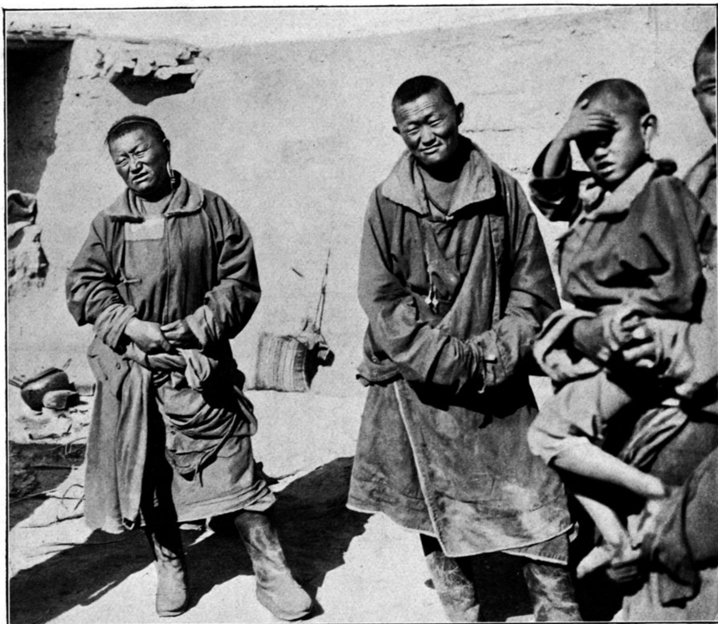
Der Dsassak von Barun, sein Bruder und sein Söhnchen.